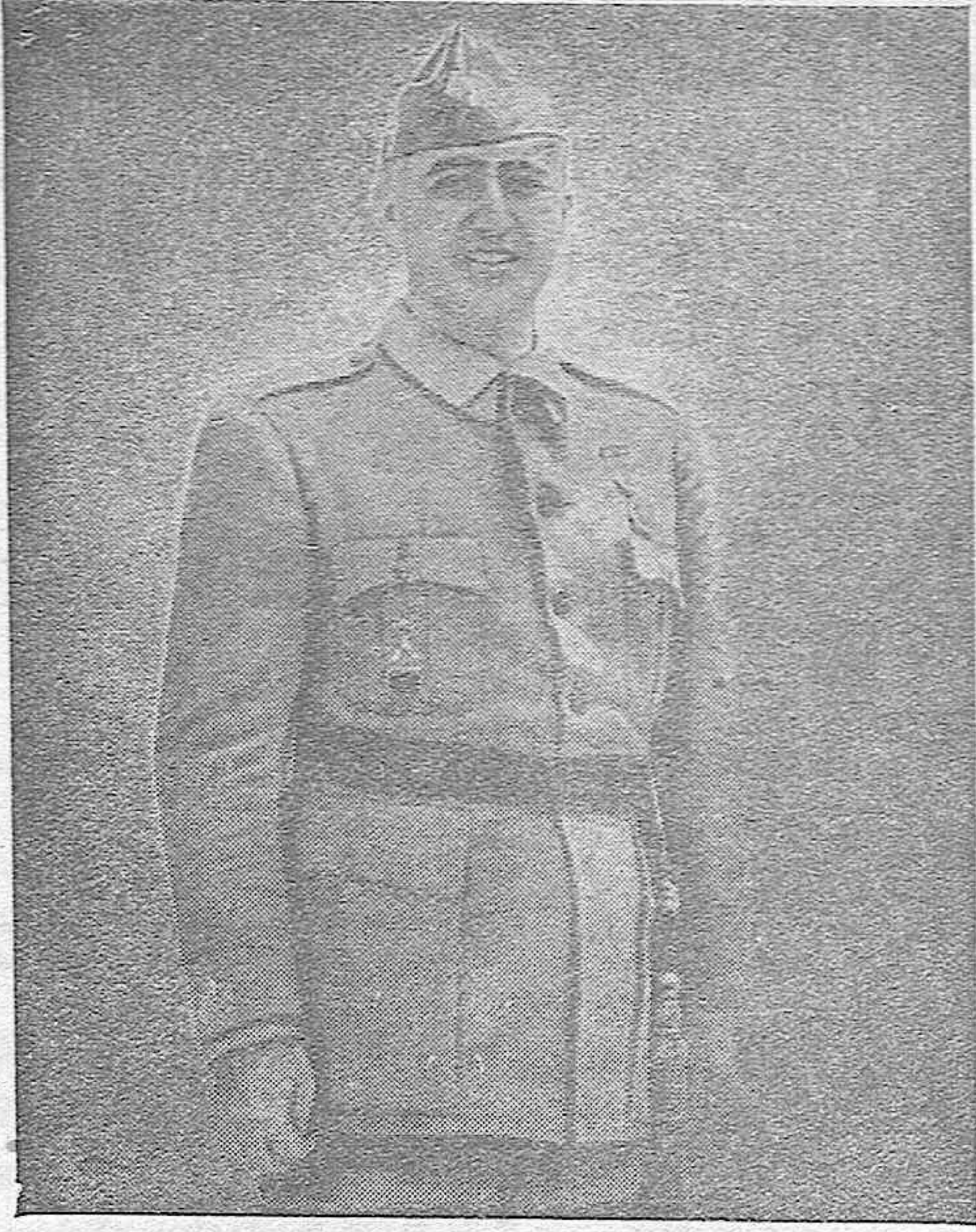
El jefe del Estado, excelentísimo señor don Francisco Franco Bahamonde, Generalísimo de los Ejércitos Nacionales y salvador del honor de España