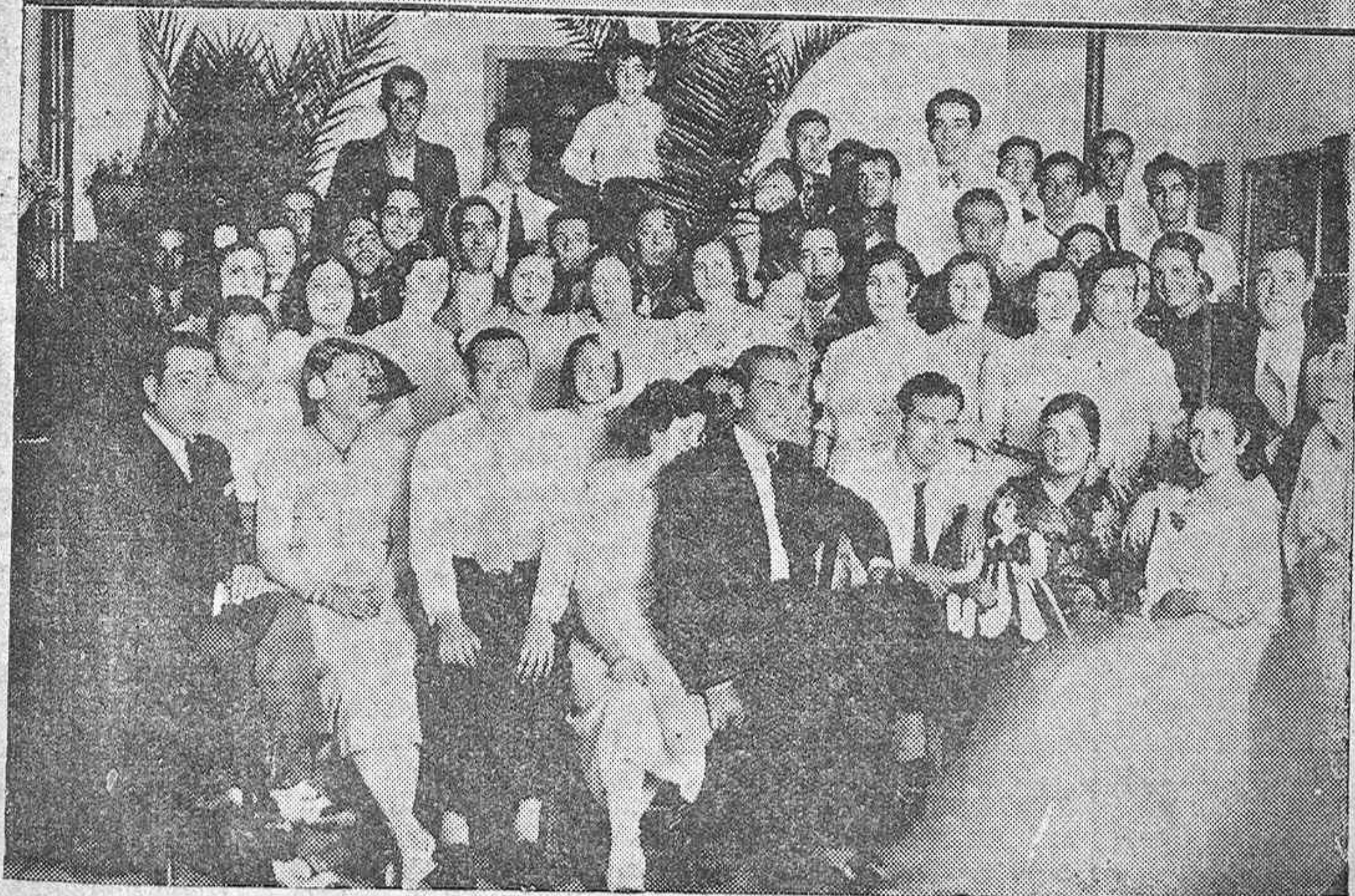
Con motivo de celebrarse el primer aniversario de la Agrupación Benavente Cibrián, organizaron una simpática fiesta andaluza en su domicilio social.—Abajo: Jóvenes que asistieron a la verbená celebrada en la calle Ocaña.