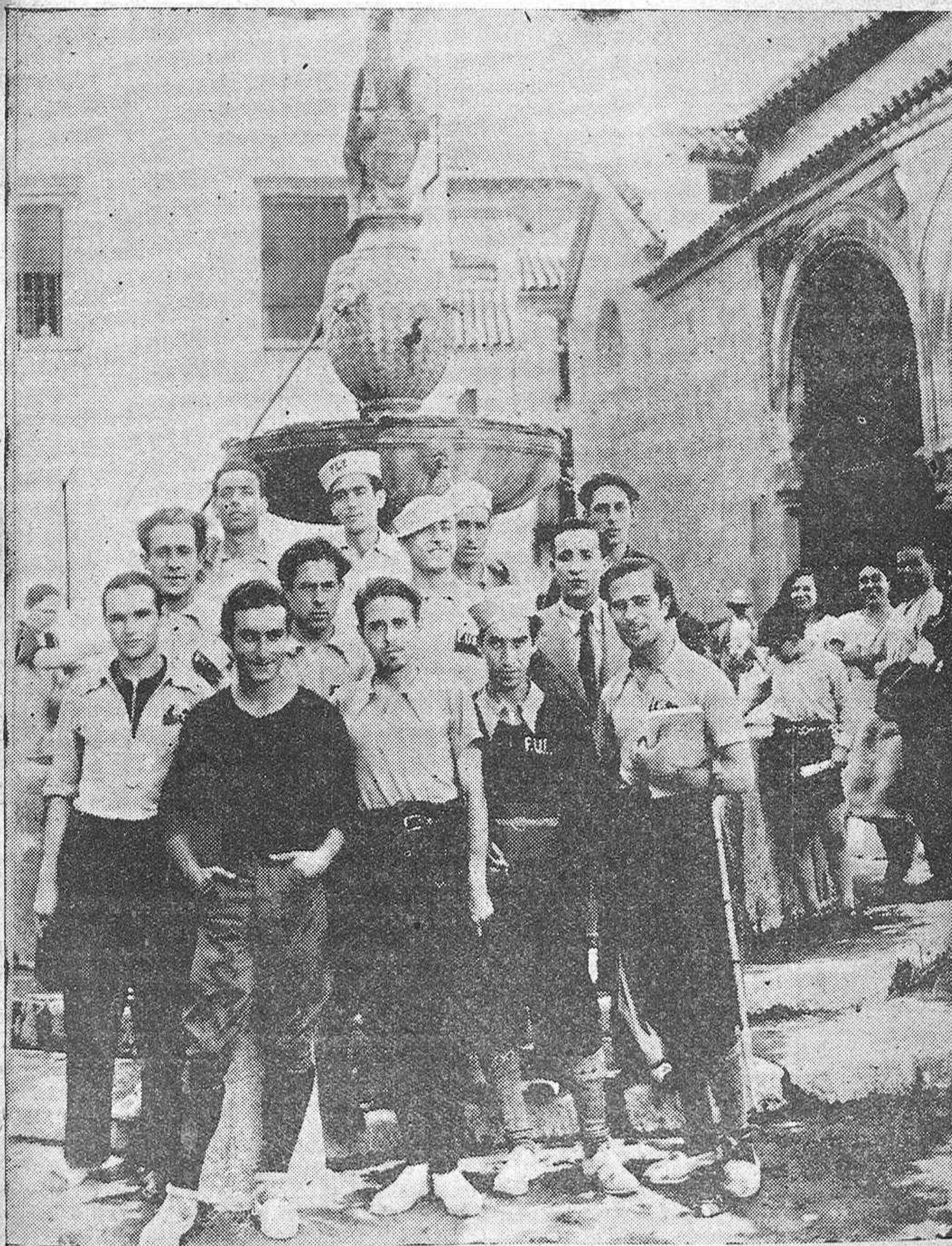
Comisión de doce estudiantes sevillanos que van a pié a Madrid para solicitar del ministro de Instrucción Pública que sea elevada a superior aquella Escuela de Bellas Artes.—Los excursionistas al salir de visitar el Museo Romero de Torres.