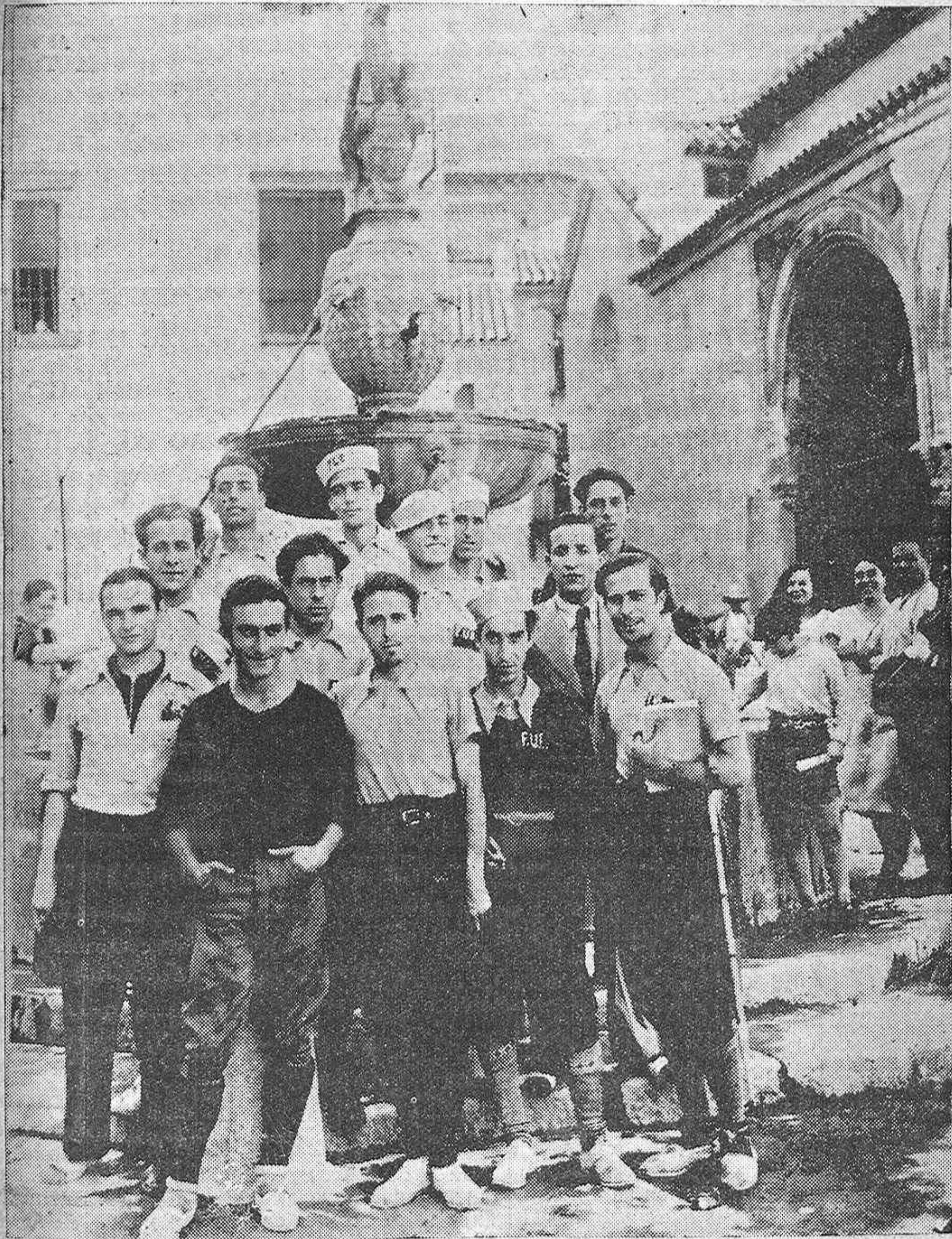
Comisión de doce estudiantes sevillanos que van a pié a Madrid para solicitar del ministro de Instrucción Pública que sea elevada a superior aquella Escuela de Bellas Artes.—Los excursionistas al salir de visitar el Museo Romero de Torres.