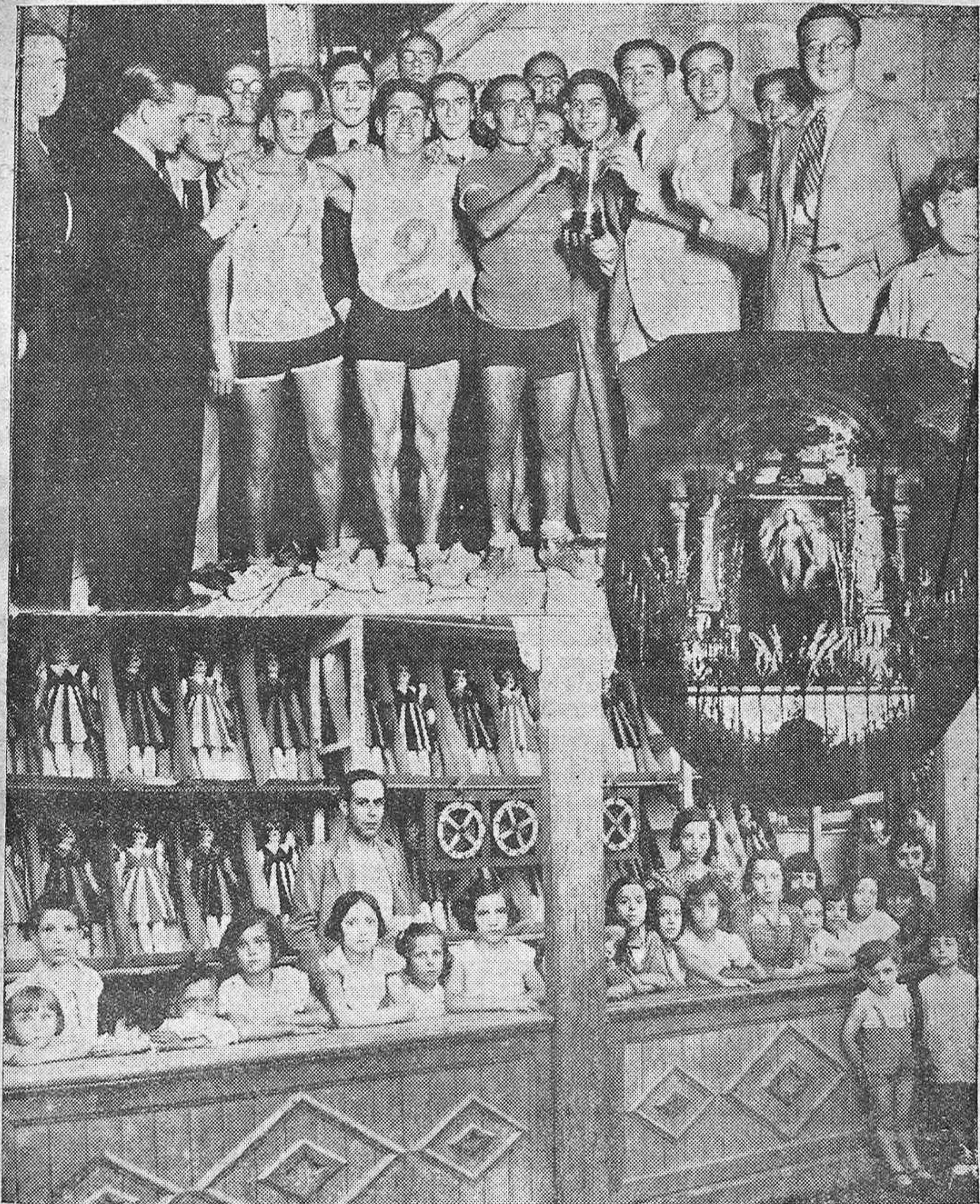
Arriba: Entrega de la copa del gobernador civil al campeón de la carrera pedestre celebrada con motivo de las fiestas del barrio de la Catedral.—Abajo: La Tómbola benéfica en el recinto del Triunfo.—En el centro: Una vista de la Virgen de los Faroles.