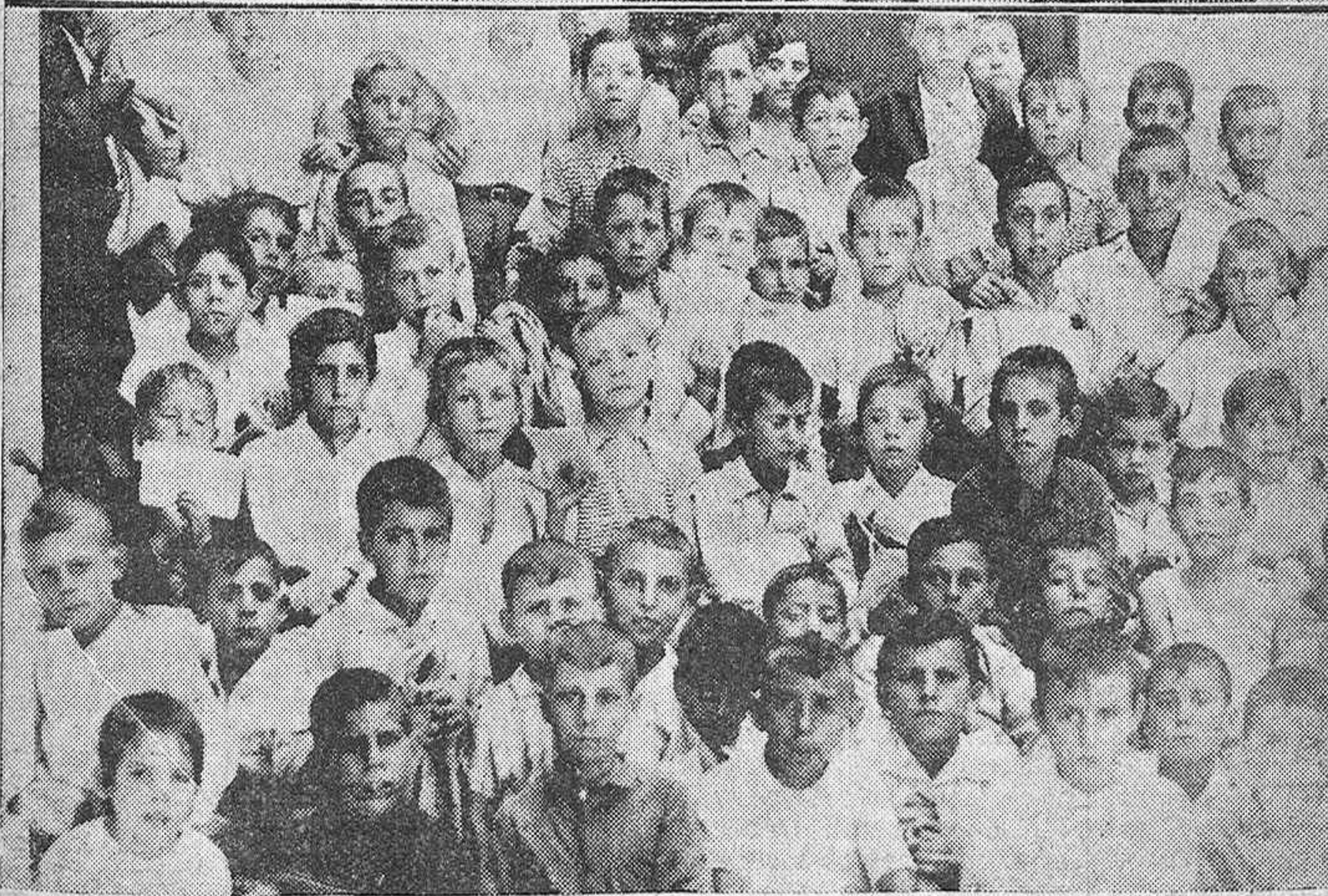
Niñas y niños que forman la segunda Colonia Escolar Marítima, que envía el Ayuntamiento a Torremolinos y que han salido para dicha playa