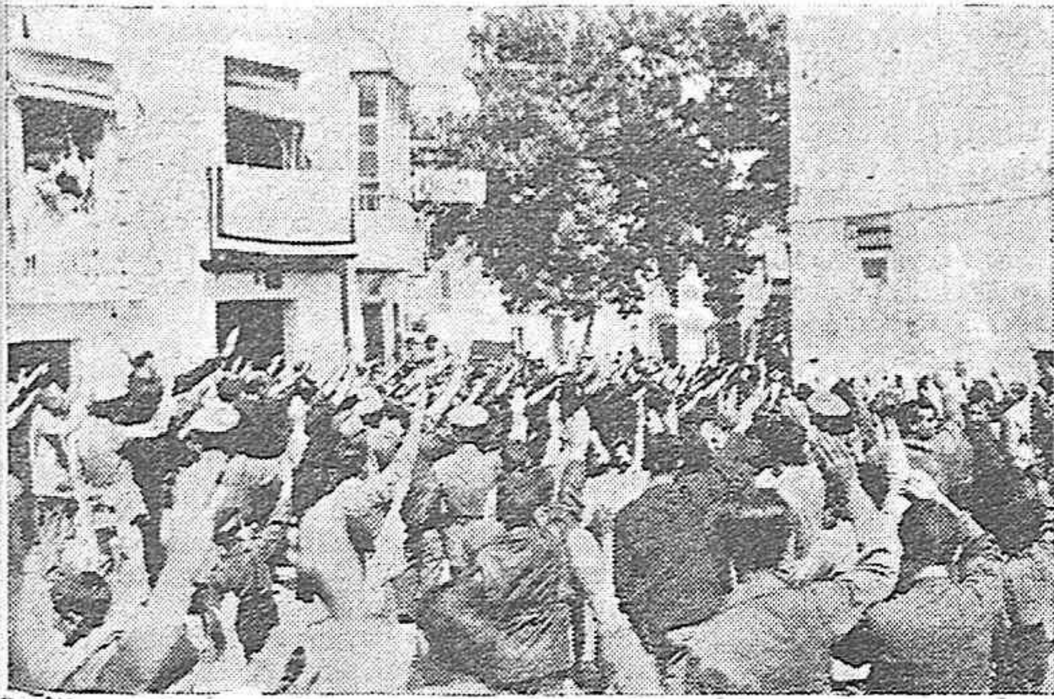
Acto de descubrir la lápida que dá nombre a la calle José Primo de Rivera.-La multitud saluda al escuchar el Himno.

Entrega de banderas.-La voz de Falange Española Tradicionalista.-Homenaje a Italia.-¡Arriba España!