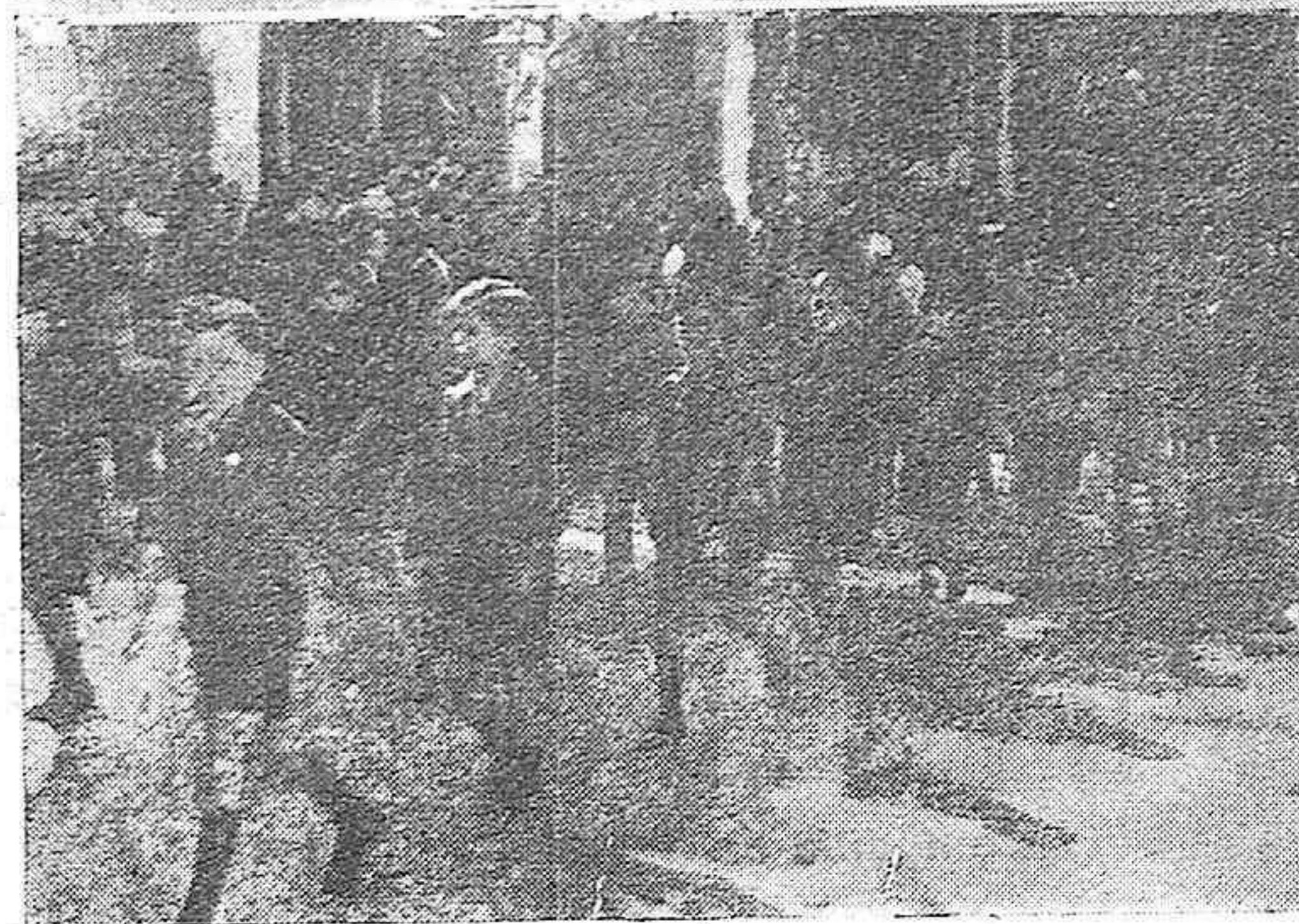
Dos aspectos del desfile de los "Flechas" ante el Gobierno Civil.