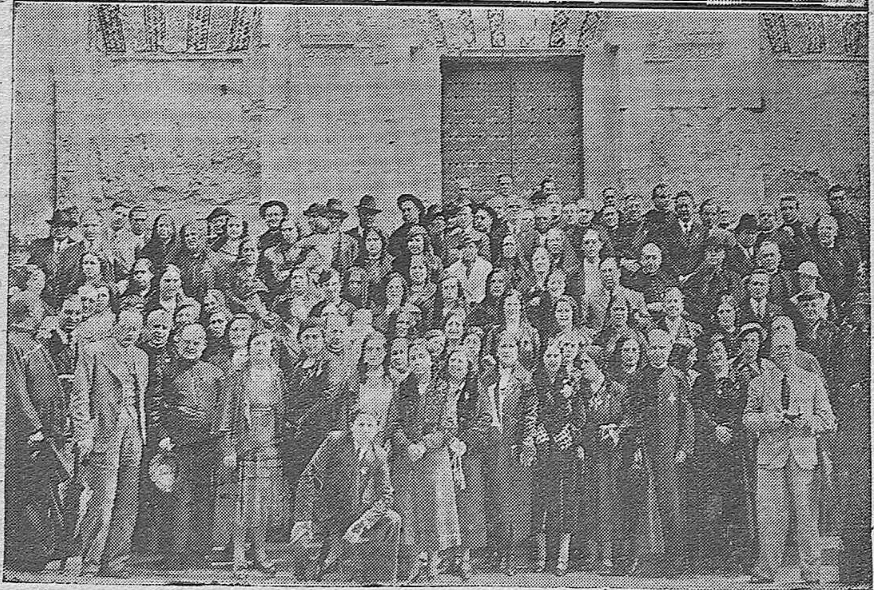
Arriba: Inspectores provinciales de Sanidad de las provincias andaluzas que asistieron a las conferencias de estudios y visitaron los centros higiénicos de la provincia de Córdoba.—Abajo: Personas que forman la peregrinación a Montilla con motivo de las fiestas que se celebran en dicha ciudad en honor del Beato Juan de Avila,