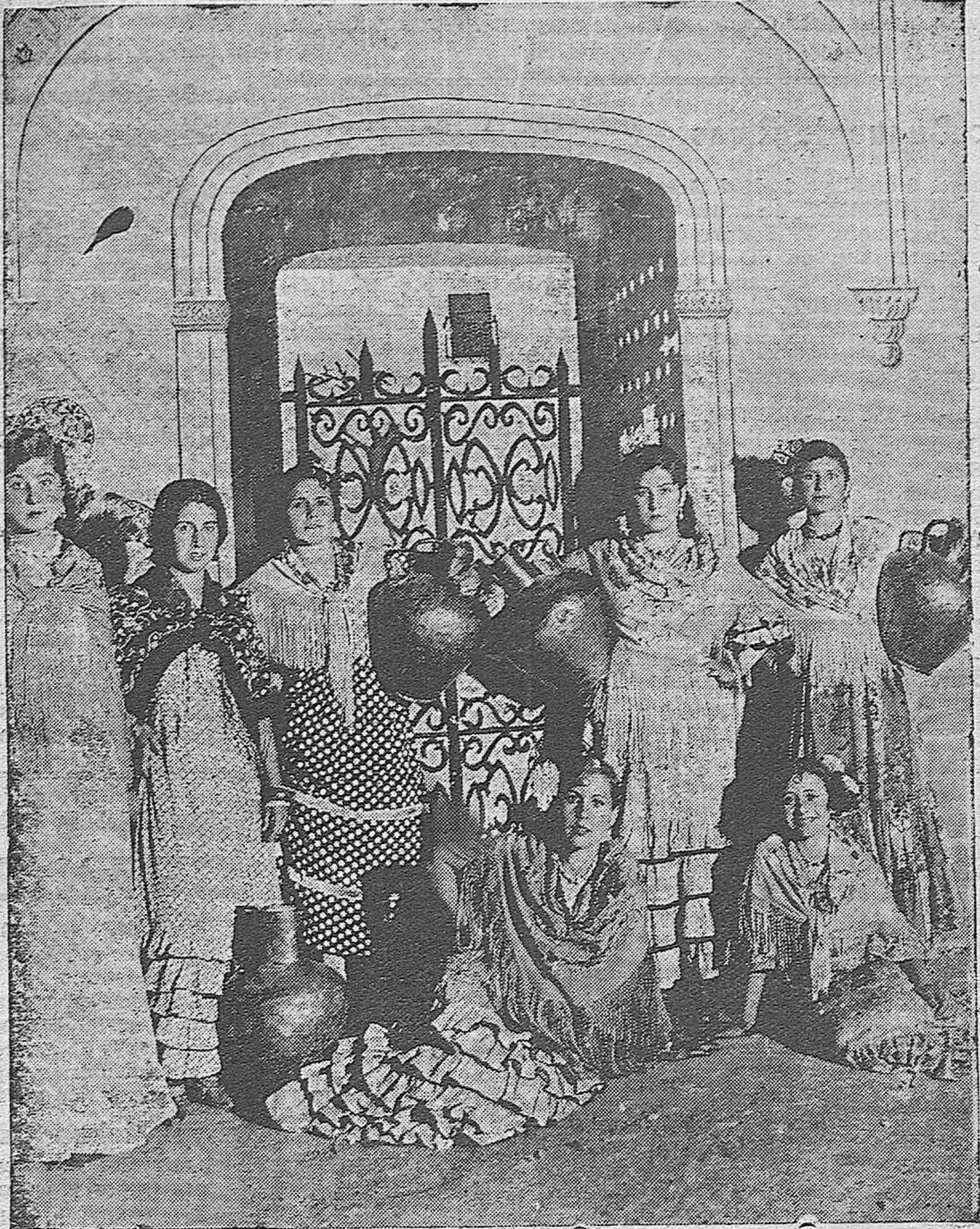
Bellas jóvenes que postularon con fines benéficos durante la fiesta celebrada el lunes en el recinto de la artística Cruz levantada en el Barrio de la Huerta de la Reina por el "Club Recreativo".