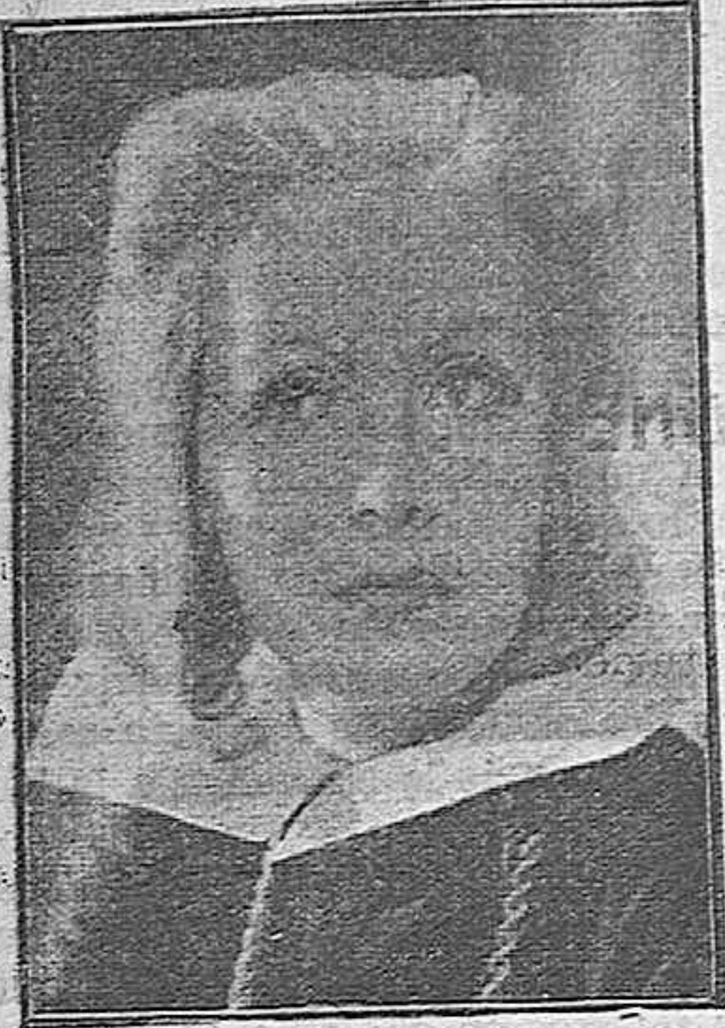
Greta Garbo que próximamente admiraremos en el film M. G. M., "El velo pintado"

Y para probar una vez más que nada le importa el tal trece, tan temido por otros, espera que "David Copperfield" constituirá uno de sus mayores éxitos... Aunque es la película decimotercera que toma parte. Las otras doce las filmó en Inglaterra.