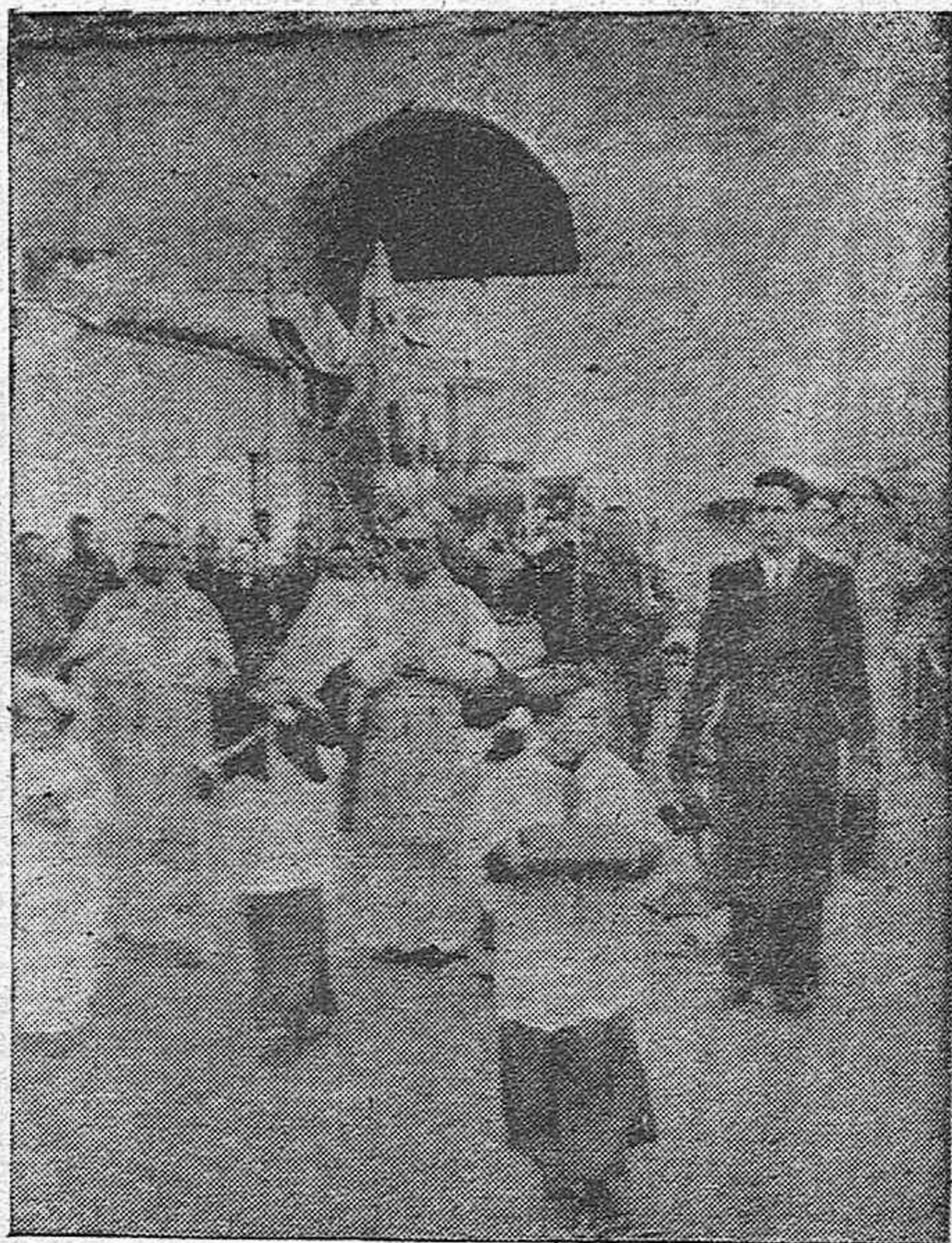
La procesión del Santísimo en el Cumplimiento Pascual de los impedidos, que salió de la Parroquia de San Juan y Todos los Santos (Trinidad) a su paso por la Puerta de Almodóvar.