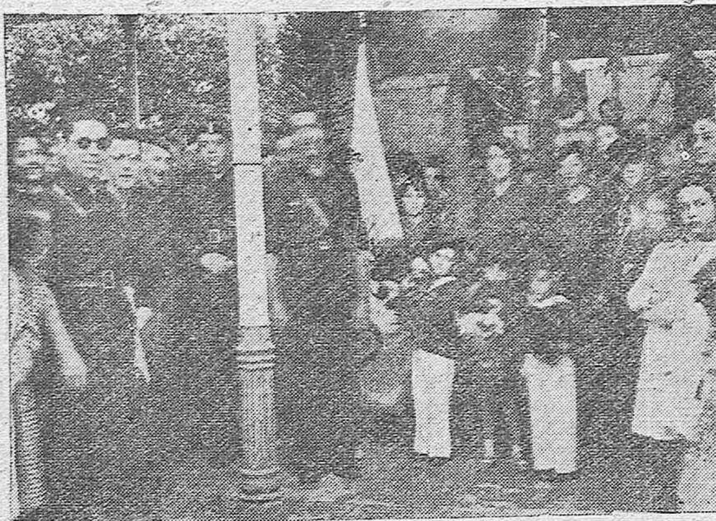
Otro aspecto del hermoso acto celebrado el domingo en Palma del Río con motivo de la bendición de las banderas de la Organización Juvenil.

La Organización Juvenil, se encontraba formada a lo largo del paseo, frente a la tribuna, donde se situaron autoridades y madrinas de