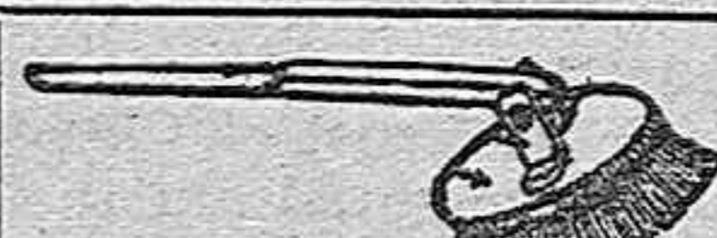
Modelo registrado n.º 8.286