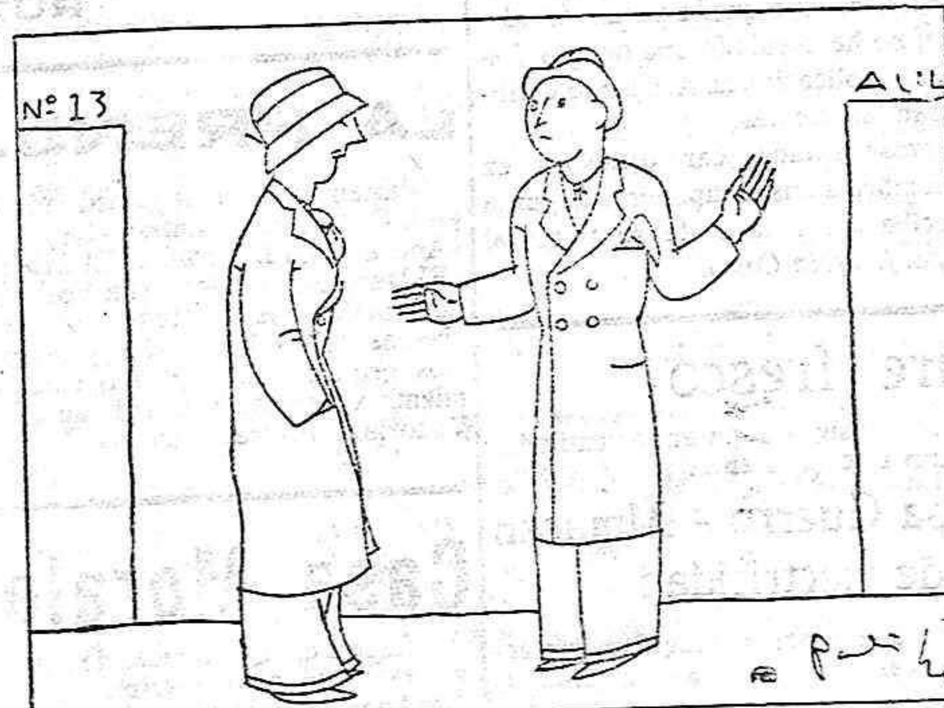
—¿Conque te han suspendido? —Sí, chico; terminé de contar la primera bola, y me dijo el tribunal: «Retírese usted y no diga más bolas».