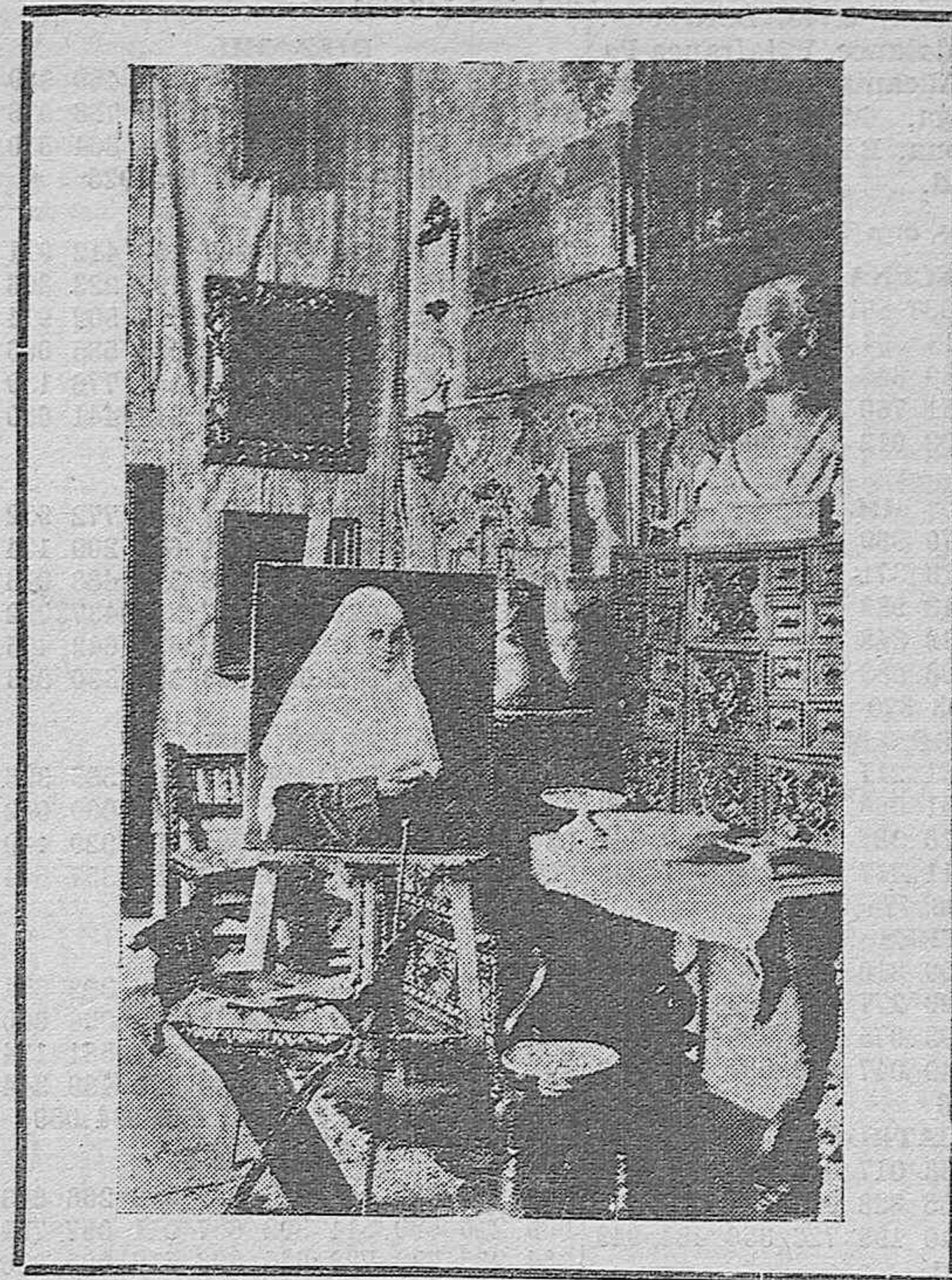
Un detalle del estudio de Romero de Torres.—En el caballete el último lienzo donde trabajaba el artista.—Al lado la paleta silenciosa, donde duerme para siempre la maravilla creadora del pintor.