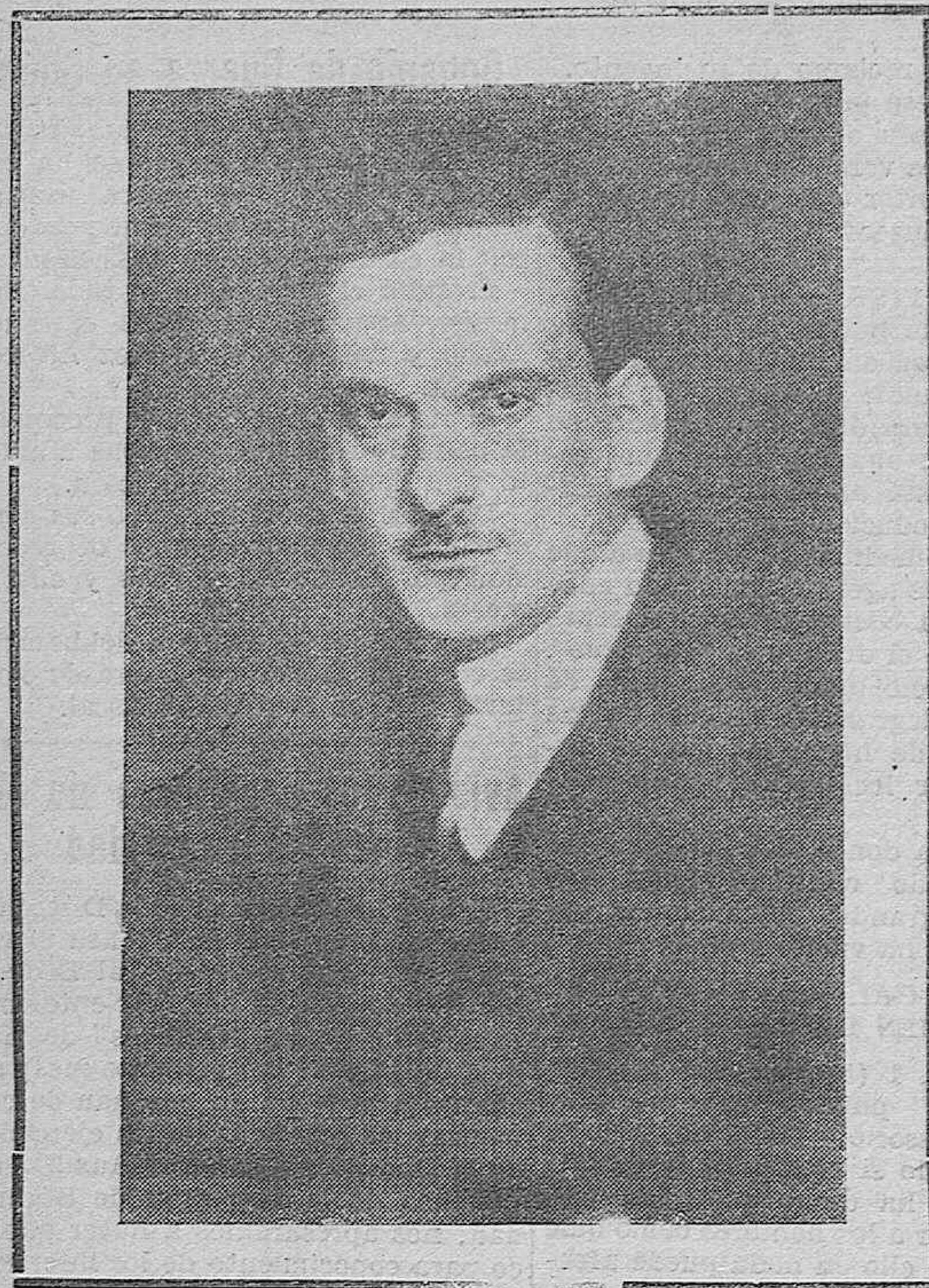
El gran pintor poeta de Córdoba.

Córdoba vé ya cristalizada la idea de llevar al mármol el recuerdo de Romero de Torres. Nada es nuevo ni es viejo cuando de Julio Romero se habla. Todo es diverso si se le refiere, y jamás se agota para el espíritu, el tema de su gloria y de su Arte. En los peregrinos tras la Belleza, que él cantara con los pinceles, jamás decae el arrobamiento en la contemplación de sus cuadros, y las palabras a él dirigidas, como una ofrenda, toman matiz de oración.