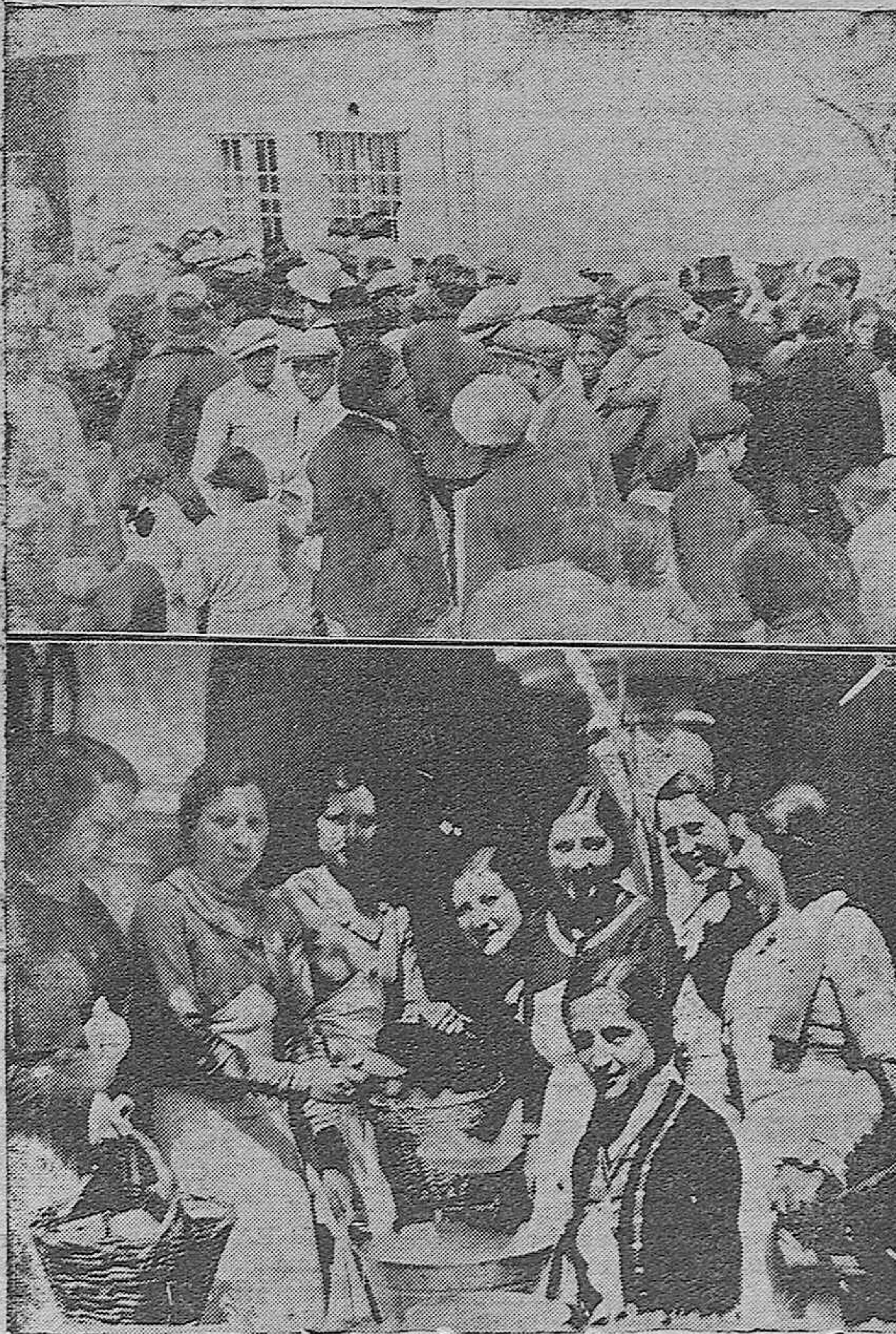
Arriba: Inauguración del Comedor de Caridad de Bujalance.—Abajo: Distinguidas señoritas que sirven a diario la comida en aquella benéfica institución.