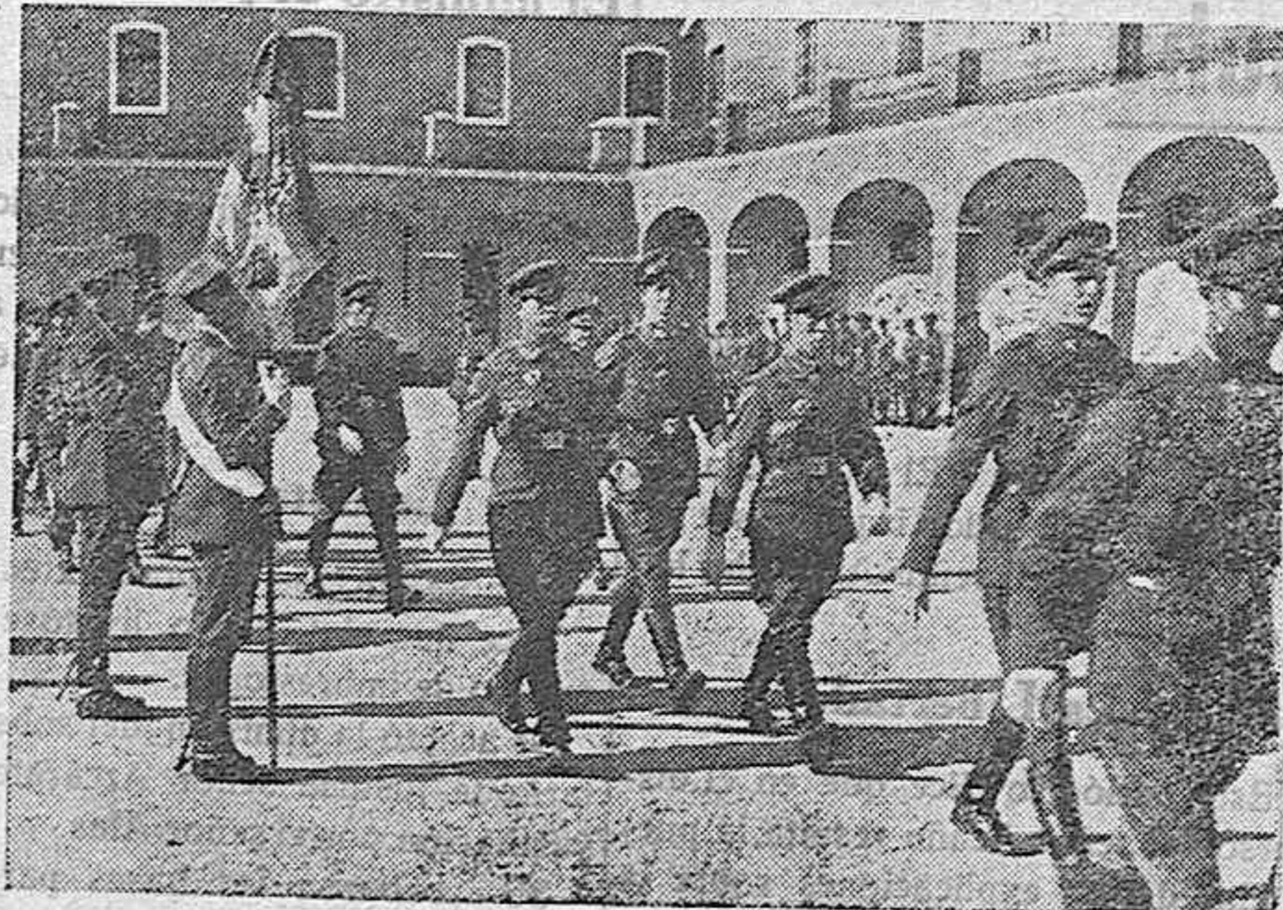
El acto de la jura de bandera de los nuevos reclutas de Caballería al pasar ante el Estandarte republicano.

LA JURA DE BANDERA EN EL CUARTEL DE CABALLERIA NUM. 8