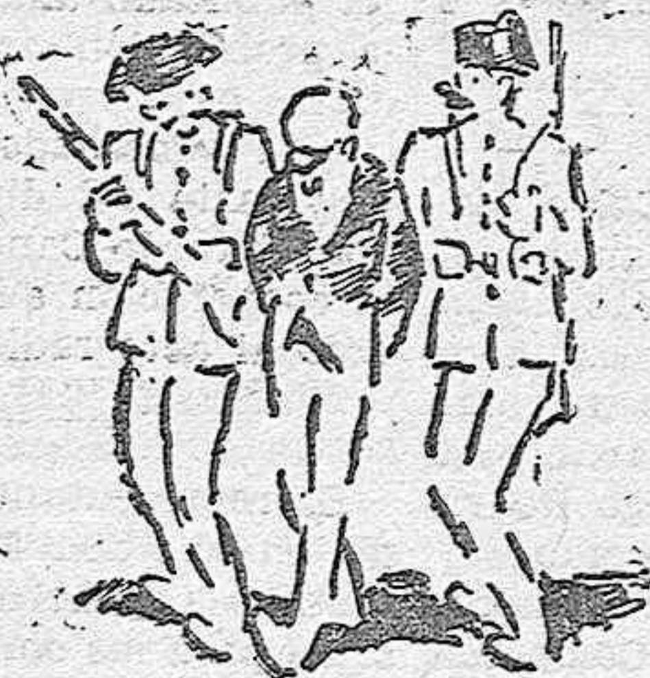
no prenda usted a los [ladrones