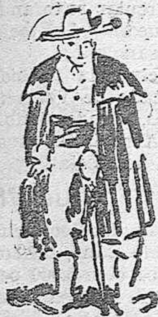
—Señor Alcalde ma- [yor