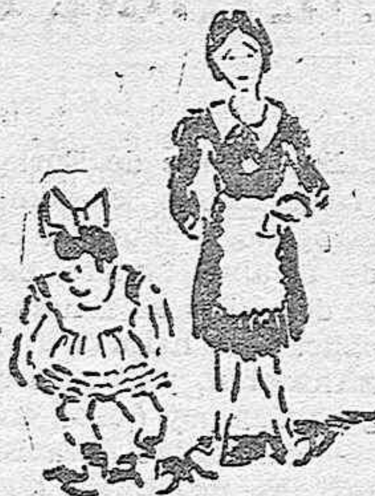
porque tiene usted una [niña