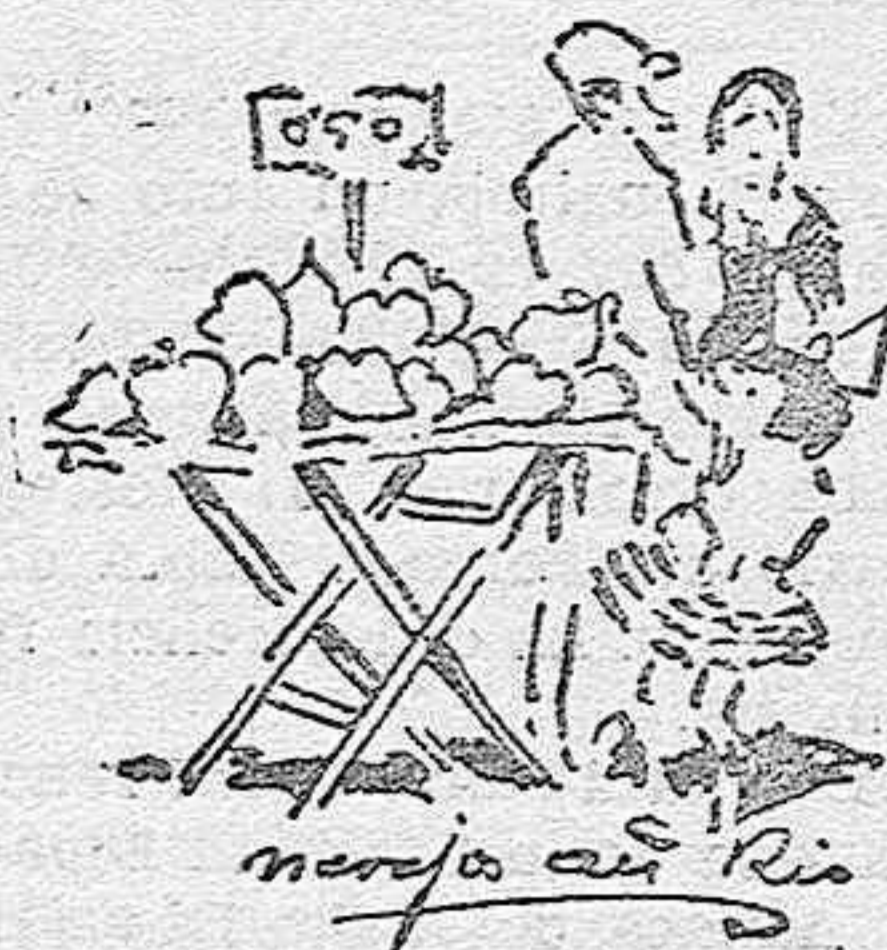
que roba los corazones.