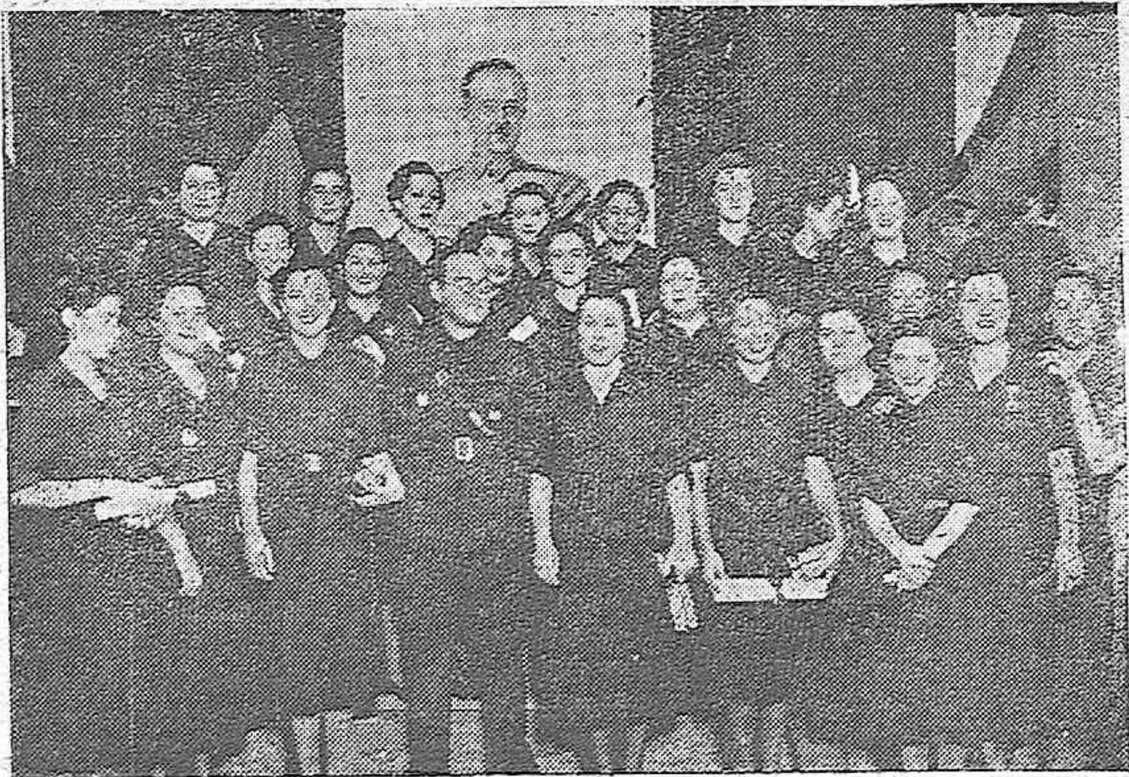
Grupo de nuestras Camaradas de la Sección Femenina, a las que le fueron entregados sus Diplomas de Enfermera en el acto celebrado en el Instituto de Córdoba

El estilo nuevo sigue su paso seguro por la Hacienda local, adoptando medidas eficaces para su consolidación. Esta que comentamos es una de ellas.