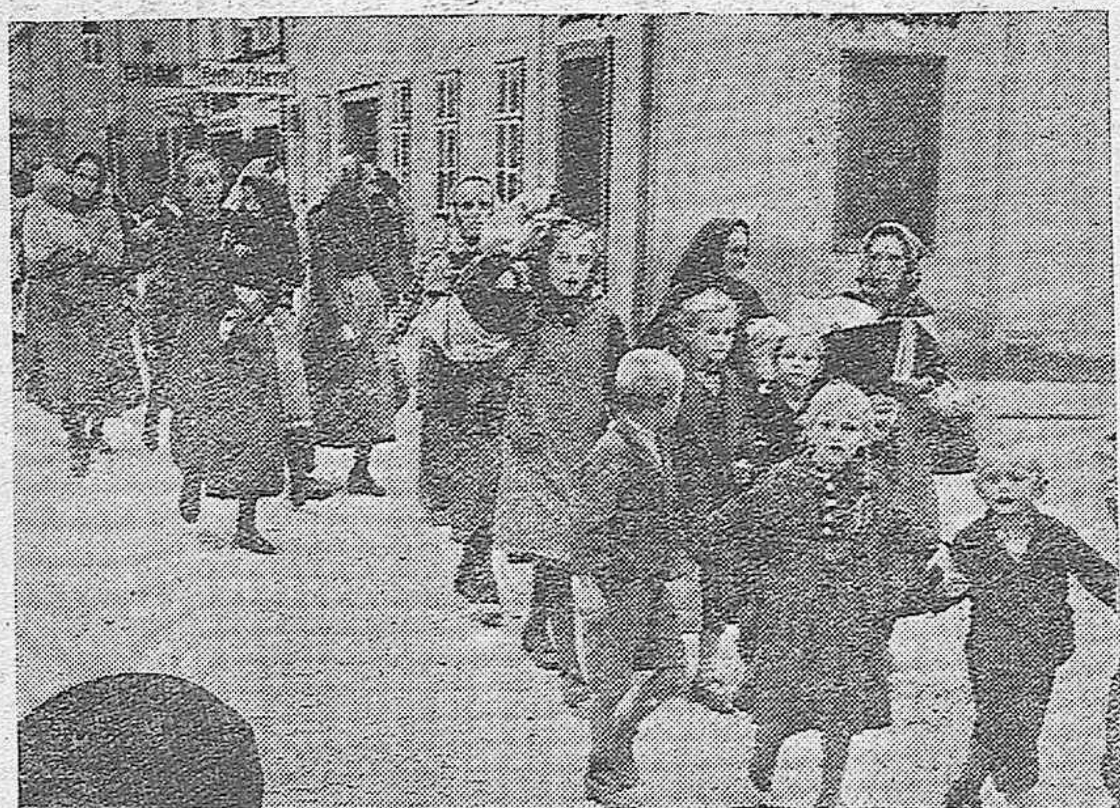
234.000 alemanes sudetes se refugiaron en el Reich huyendo del terror checoslovaco.-Un grupo de mujeres y niños de la Alemania sudete, cuando pasaban la frontera.