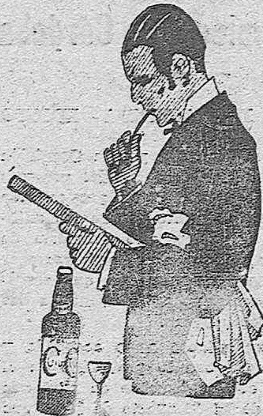
MONTILLA siempre Cruz Conde

CALLE JESUS MARIA, número 1.— Teléfono, 27-54. (Frente a Correos)