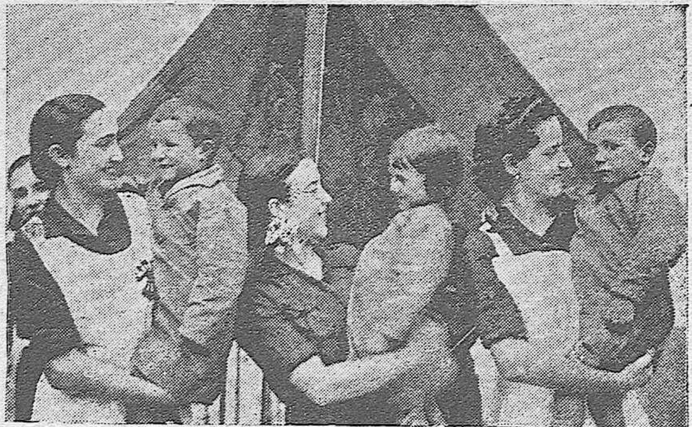
Nuestras camaradas de "Auxilio Social" de Bonameji, que prestan servicio en los Comedores y Escuela "José Antonio" de dicho pueblo.