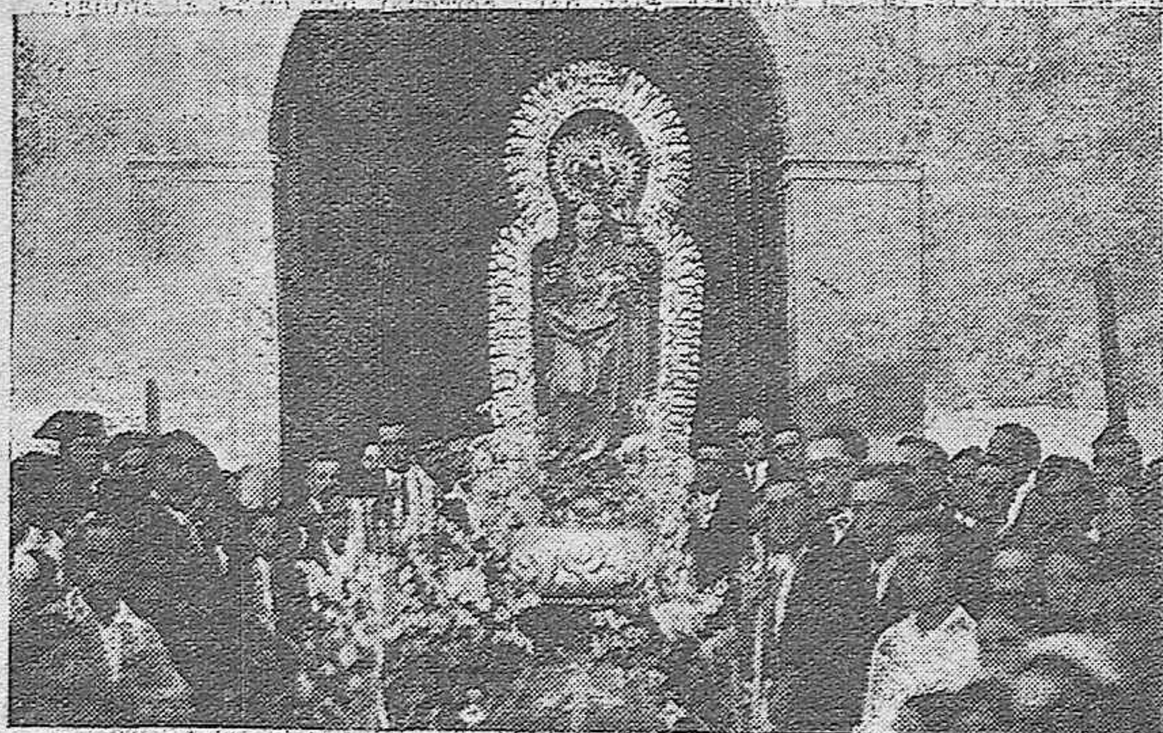
Salida procesional de la Santísima Virgen de Gracia Patrona de Benamejí