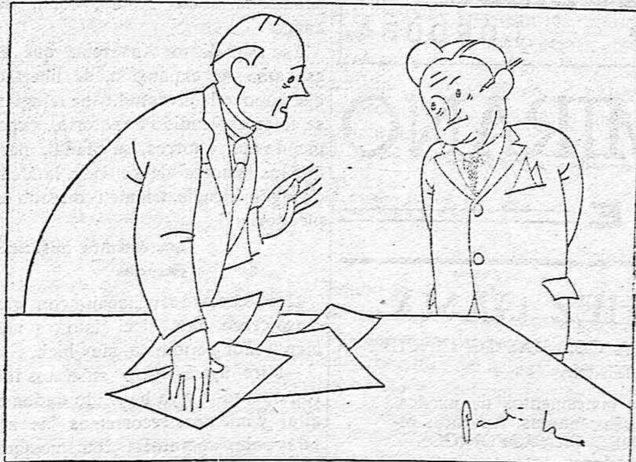
—¡Pero es absurdo! En este balance aparecen tres millones sin justificar. —¡Señor! Es que fui contable en la Exposición de Sevilla, y allí sufrí—mos estas pequeñas distracciones...