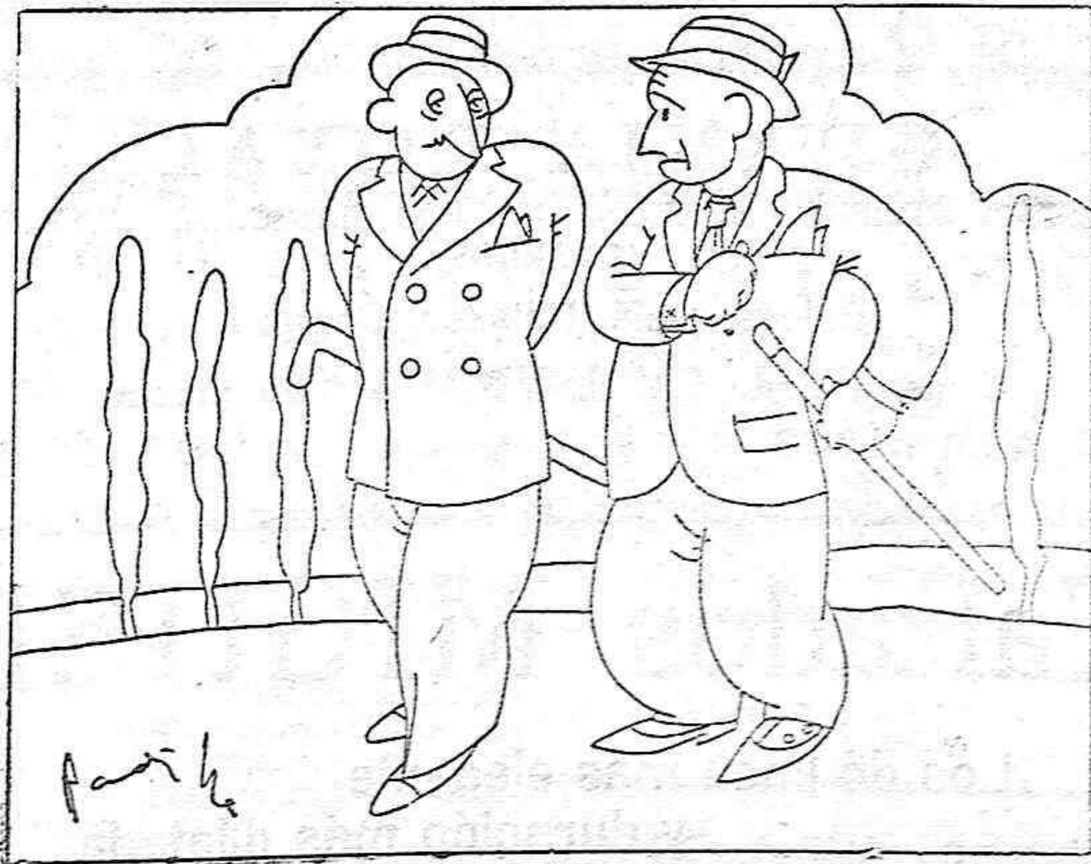
—A mí, la verdad, el cine me aburre y me da sueño. —¡Es natural! ¡Siempre va con la mujer!

Toda la correspondencia al APARTADO NÚM. 74