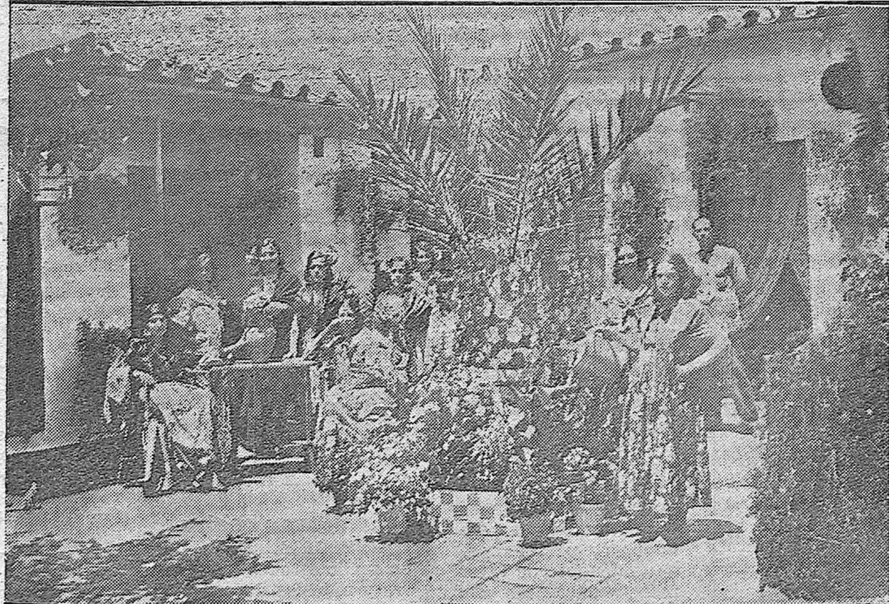
CONCURSO DE PATIOS CORDOBESES. —Arriba: Patio de la calle de San Juan de Palomares al que se ha concedido el primer premio de 500 pesetas. El Centro Filarmónico dió un concierto en el mismo. — Abajo: Patio de la calle del Chaparro, 20, al que se ha dado el segundo premio, de 300 pesetas, y en el que dió un concierto la Banda Municipal.