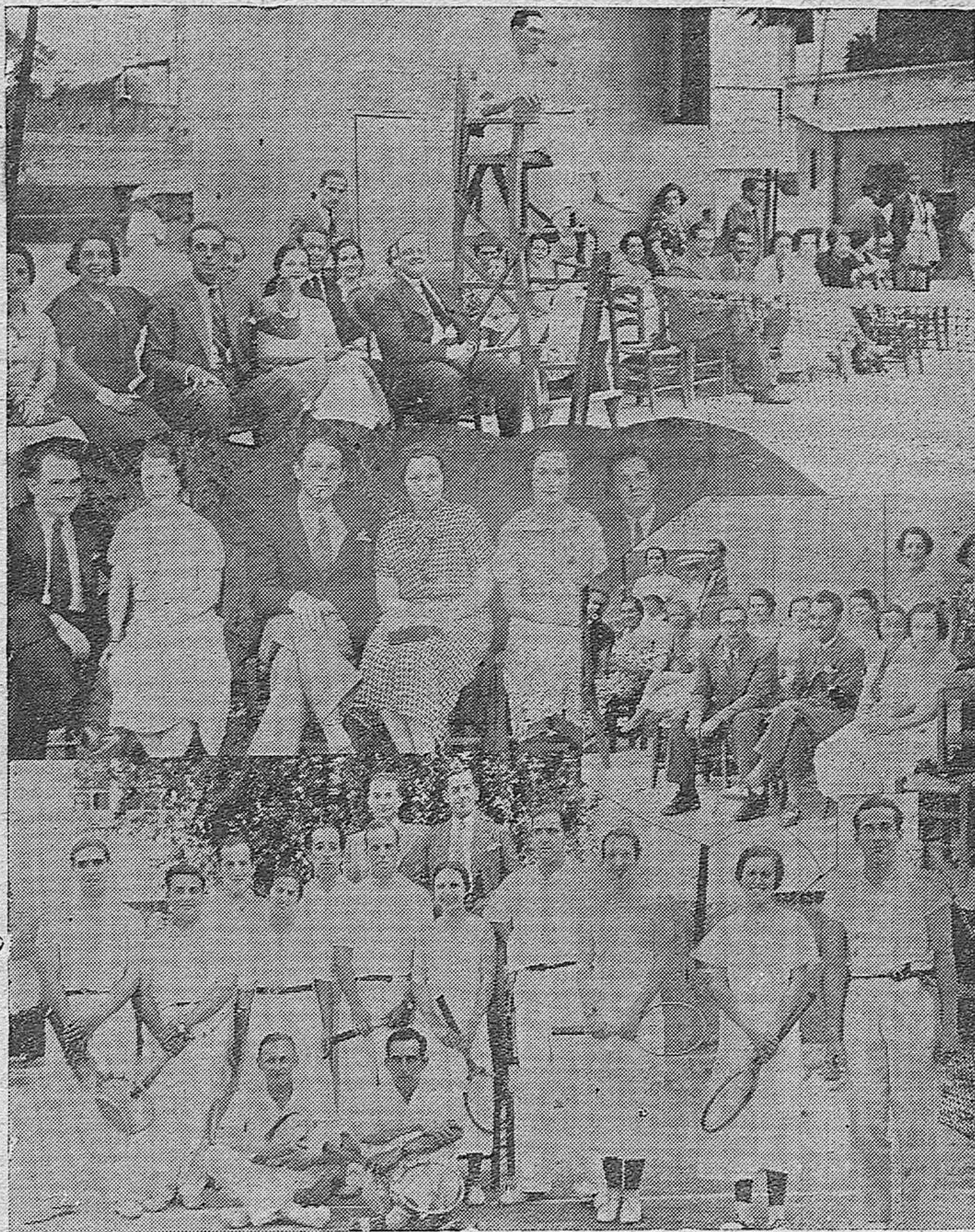
EN EL CAMPO DE TENNIS CLUB.—Partidos Inter-Club entre los equipos Bétis Tennis Club y Tennis Club Córdoba.—Bellas señoritas presenciando las interesantes jugadas.—Los equipos sevillano y cordobés, de los cuales quedaron vencedores los segundos, en las jugadas de singles, dobles damas y dobles caballeros.