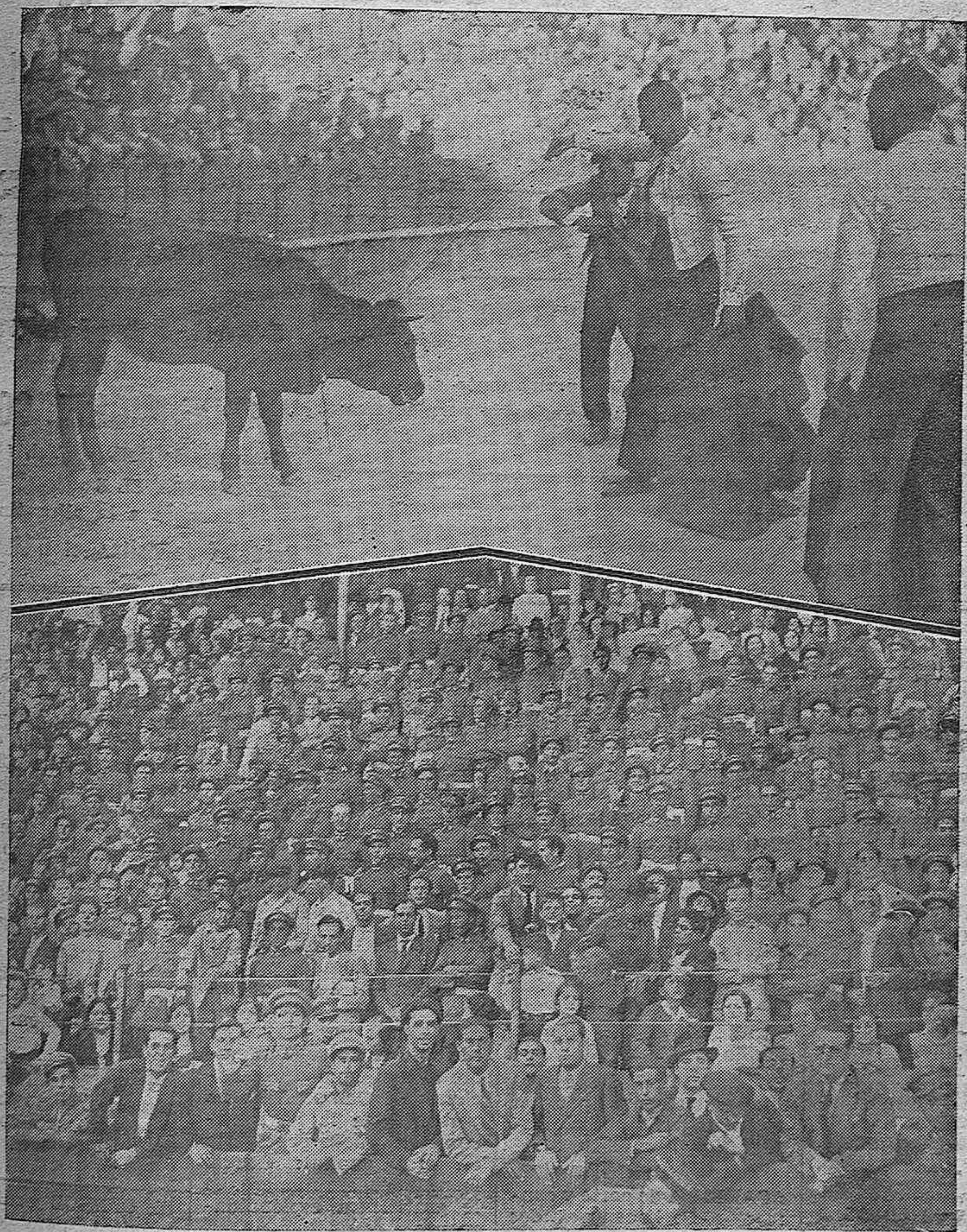
LA FIESTA DEL EJERCITO.—“El Negrito”, uno de los “fenómenos” del regimiento de Artillería, que intervinieron en la becerrada celebrada con extraordinario éxito en la plaza de toros. Aspecto de uno de los tendidos ocupado por soldados de la guarnición de Córdoba