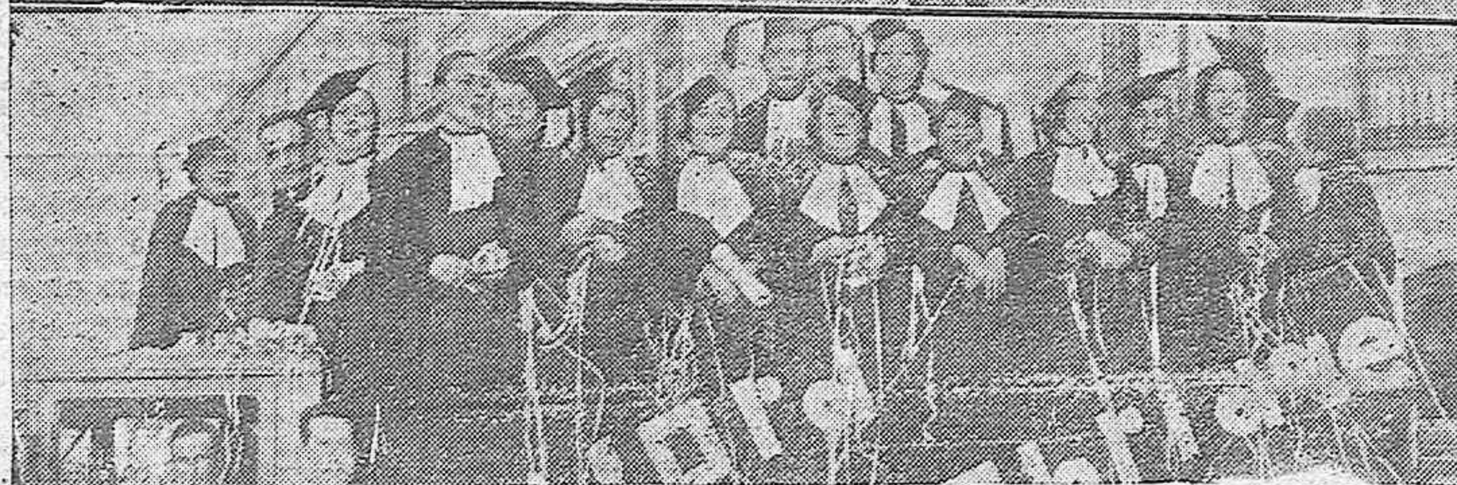
EL CARNAVAL EN CORDOBA.—Arriba: Bellas señoritas que tomaron parte en la batalla de flores celebrada en la tarde de ayer en el Paseo de la Victoria.—Abajo: Dos de las carrozas ocupadas por lindas mascaritas durante el desfile.