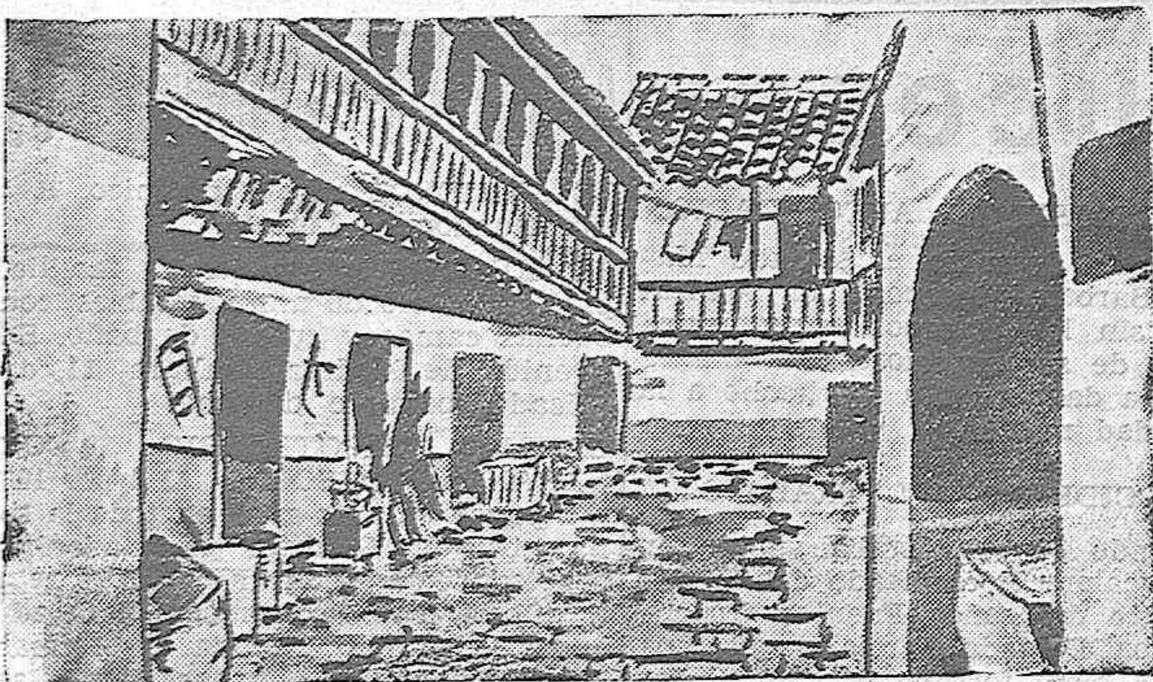
Lugar cervantino, de un interés extraordinario, verdadera estampa de la época