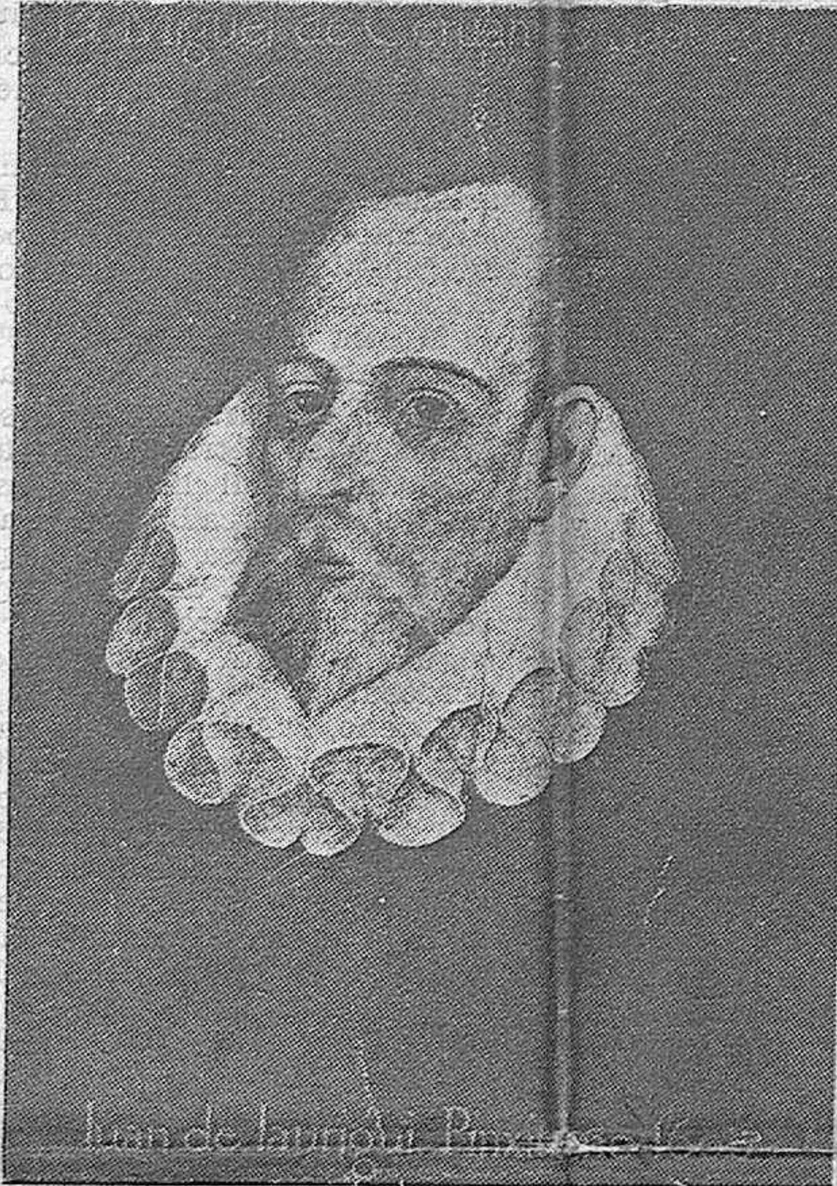
Retrato auténtico, de Juan de Jáuregui