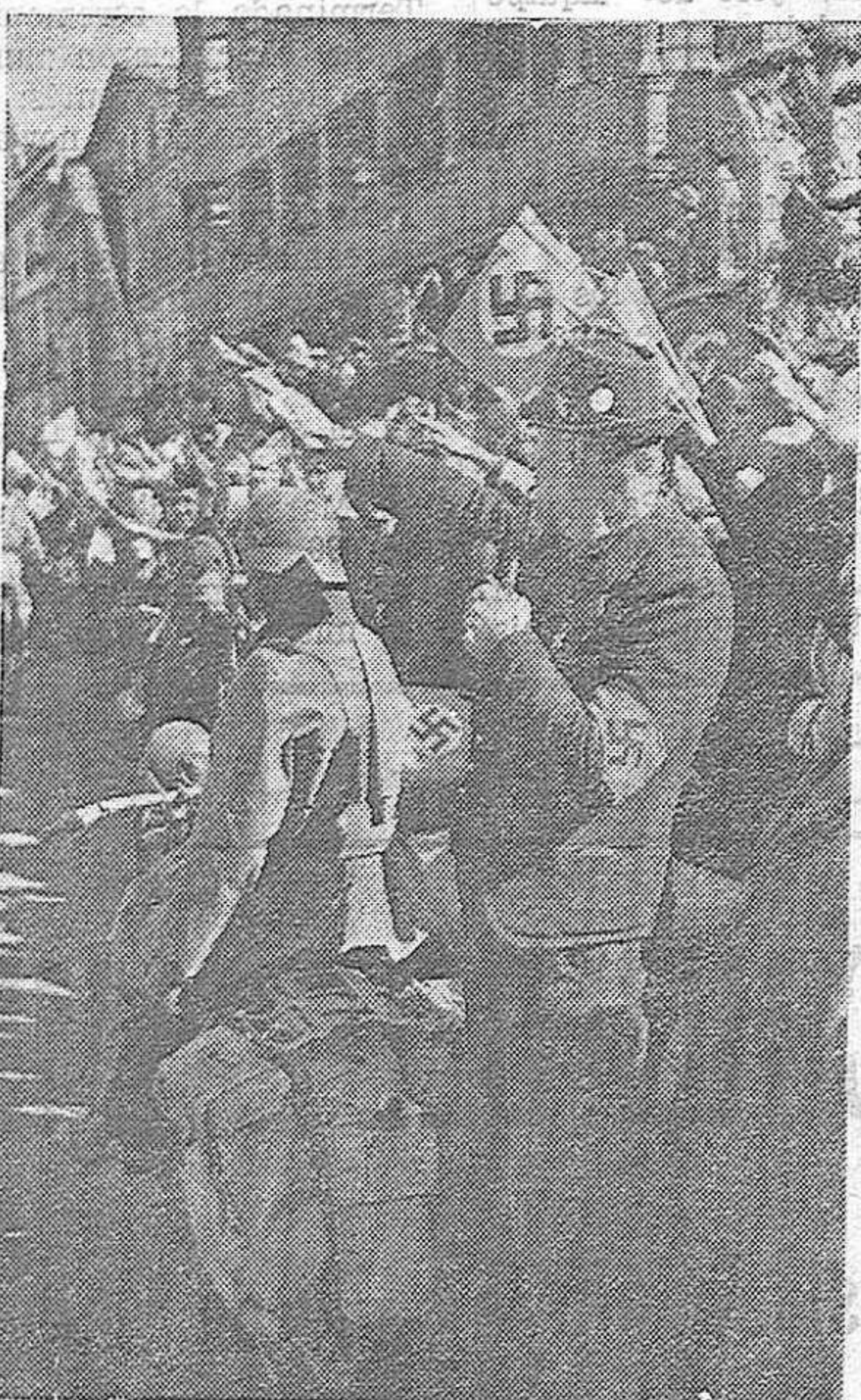
DE ESTA MANERA EL PUEBLO AUSTRIACO ACLAMABA A LAS TROPAS ALEMANAS QUE HACIAN SU ENTRADA.