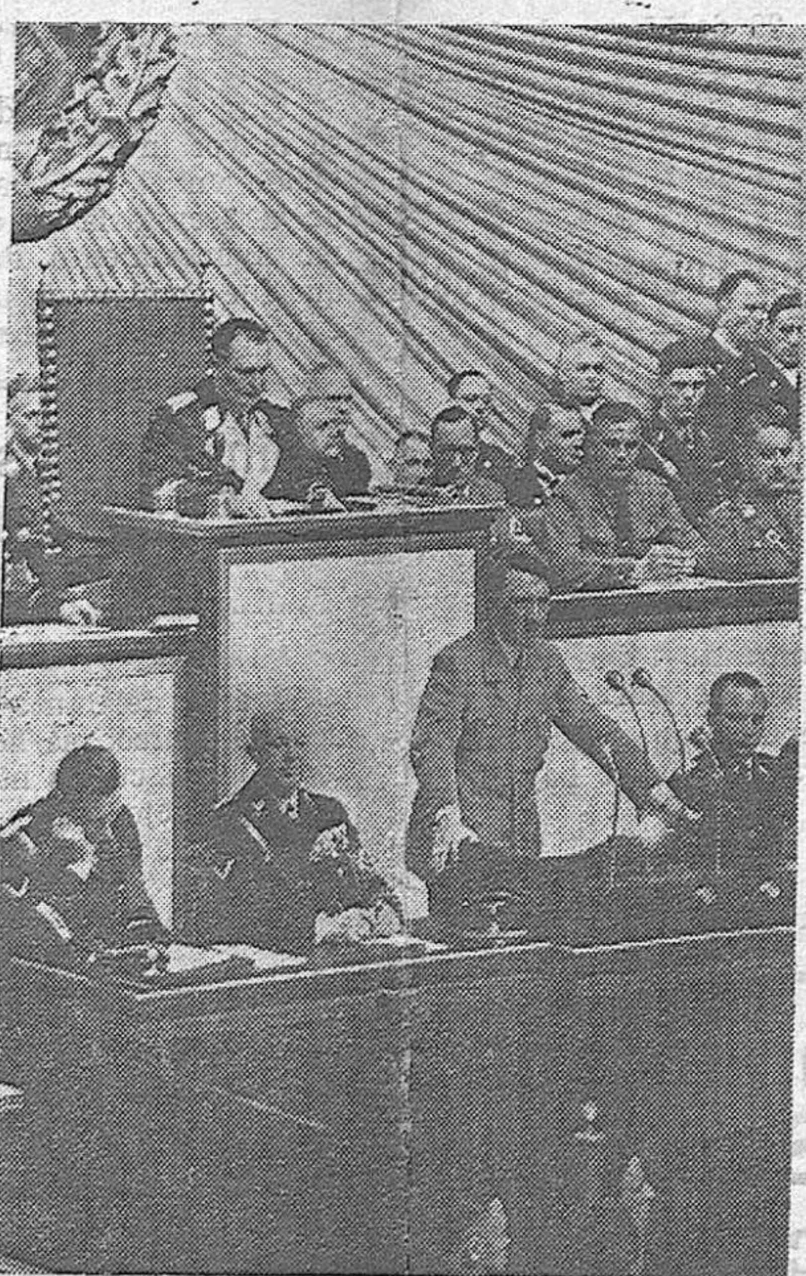
ADOLFO HITLER, EL FUNDADOR DEL IMPERIO DE LA GRAN ALEMANIA PRONUNCIÓ POR LA ÚLTIMA VEZ UN DISCURSO DELANTE DEL REICHSTAG CUYA NUEVA ELECCION TENDRÁ LUGAR EL 10 DE ABRIL POR LA PRIMERA VEZ EL GOBIERNO DE LA NACION AUSTRIACA TOMO PARTE EN LA SESION DEL REICHSTAG QUE HA SIDO DISUELTA. DETRAS DEL FUERER AL PUPITRE PRESIDENCIAL EL FELDMARISCAL HERRMAN GORING