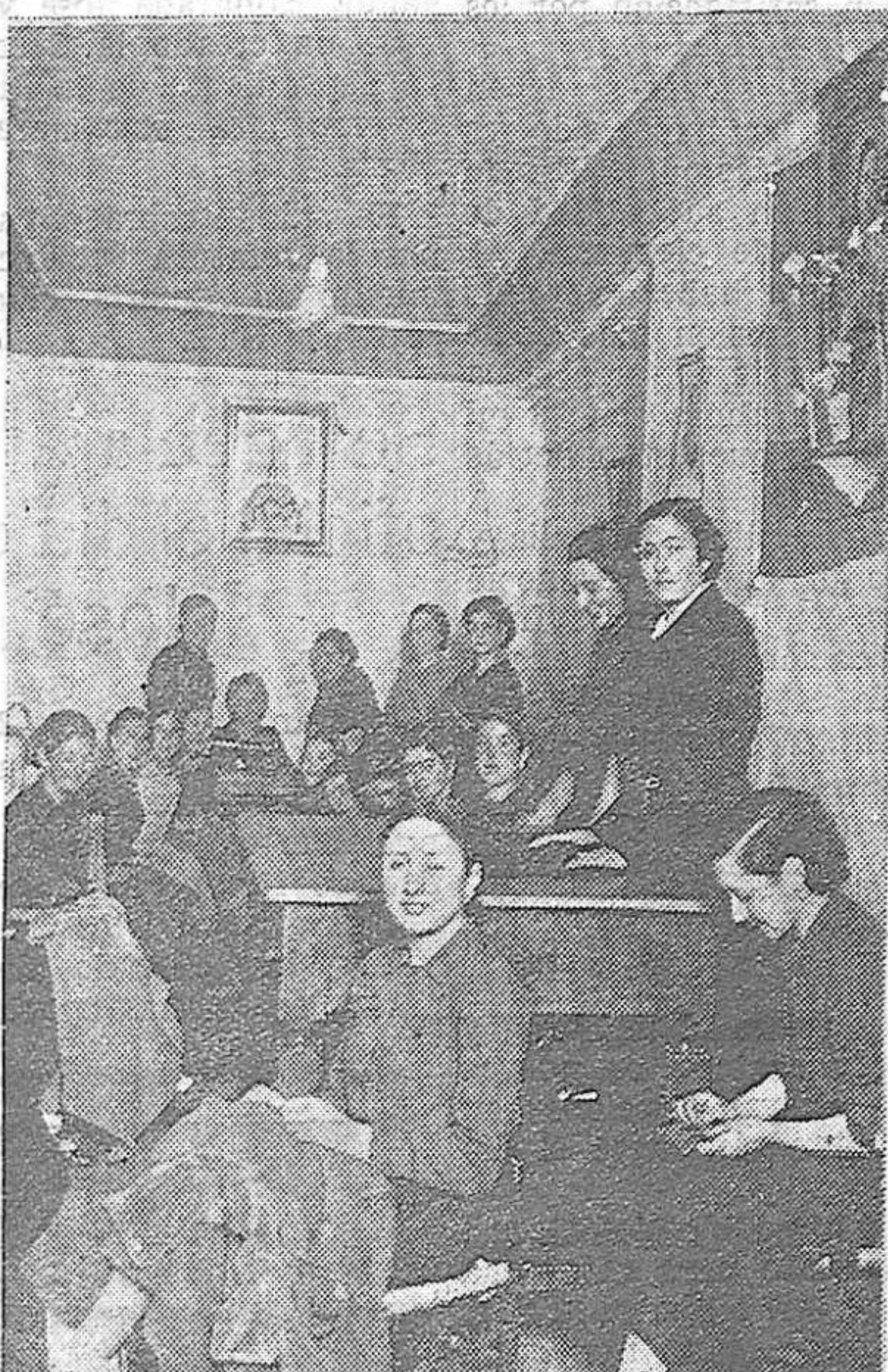
UN TALLER DE CONFECCION DE PRENDAS PARA EL EJERCITO NACIONAL, DONDE TRABAJAN CON FERVOR PATRIOTICO, NUESTRAS CAMARADAS DE LA SECCION FEMENINA