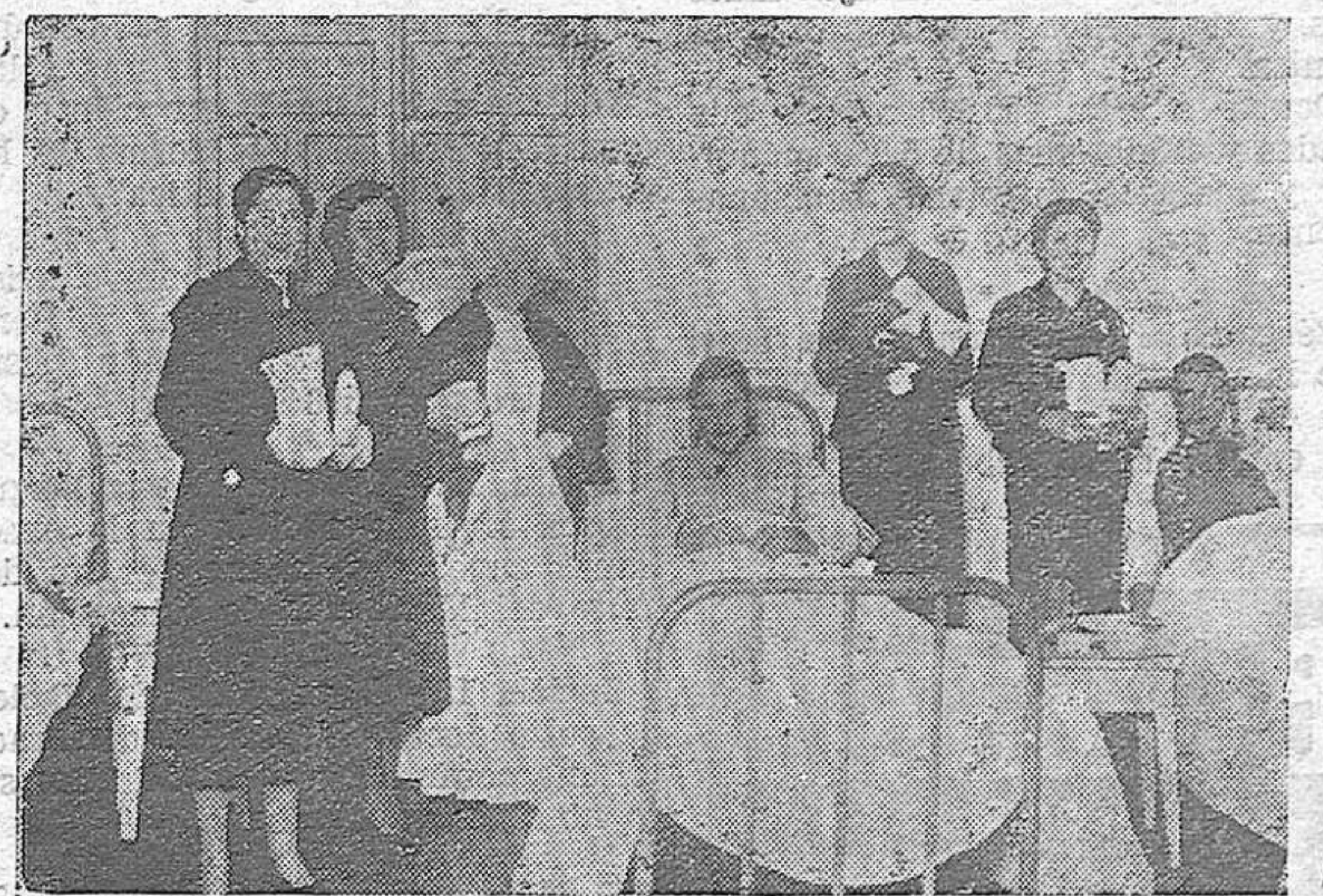
UN ASPECTO DE LA VISITA A LOS HERIDOS DE LOS HOSPITALES, REALIZADA POR NUESTRAS CAMARADAS DE LA SECCION FEMENINA.

Si ves que alguien buria, o intenta burlar, el Subsidio Pro-Combatientes, declárale la guerra. Es un enemigo encubierto, que es el peor de los enemigos.