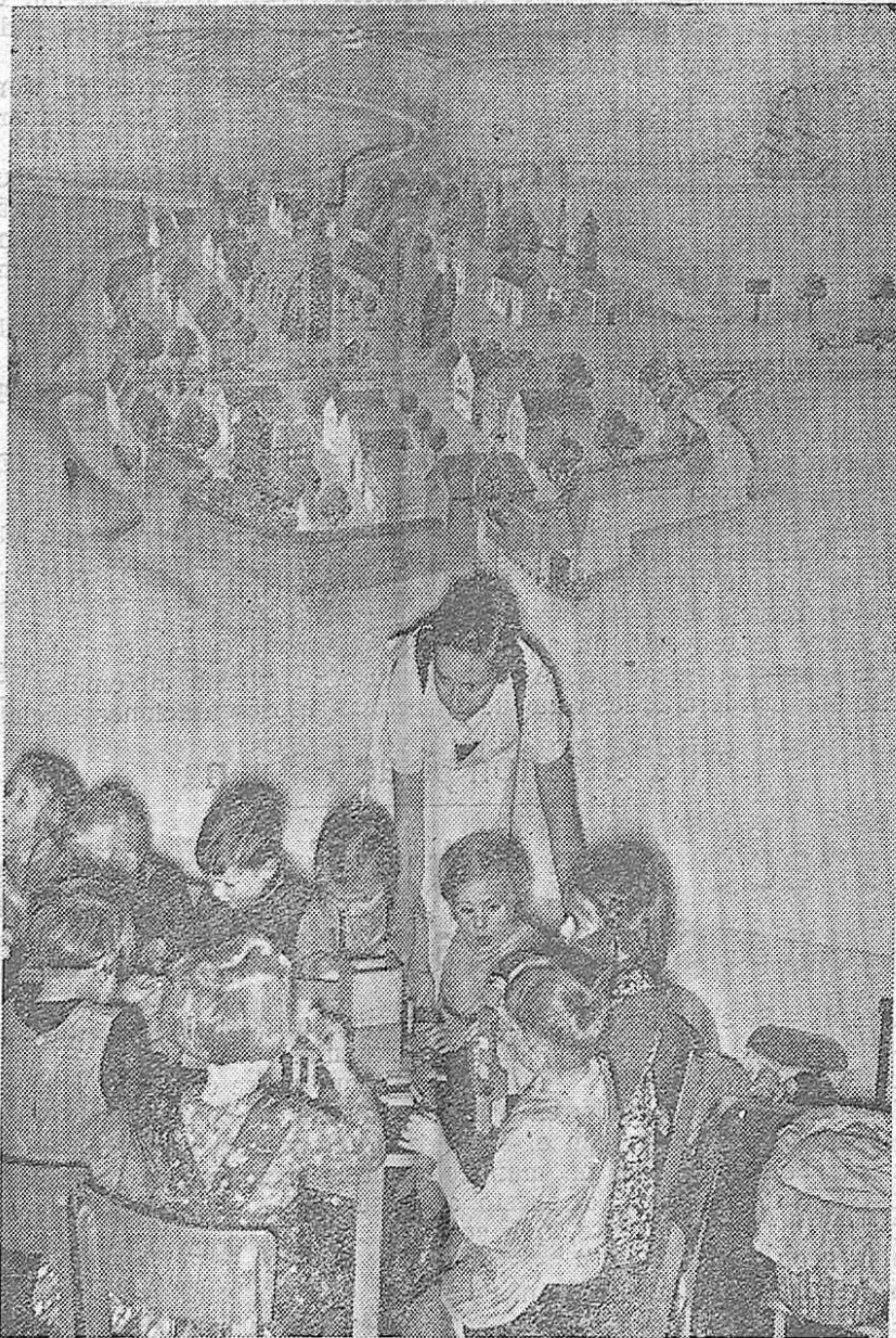
INSTITUCIONES MODELOS DE BENEFICENCIA PUBLICA NACIONAL-SOCIALISTA.—He aquí un «Kundergarten» de Berlín, para la estancia de púrvulos durante el día. Los padres de estos niños ejercen una profesión, y mientras, les dejan al cuidado de una profesora nacional-socialista.

(Del discurso pronunciado el 15 de Enero de 1938 en el Salón del Trono del Alcázar de Segovia.)