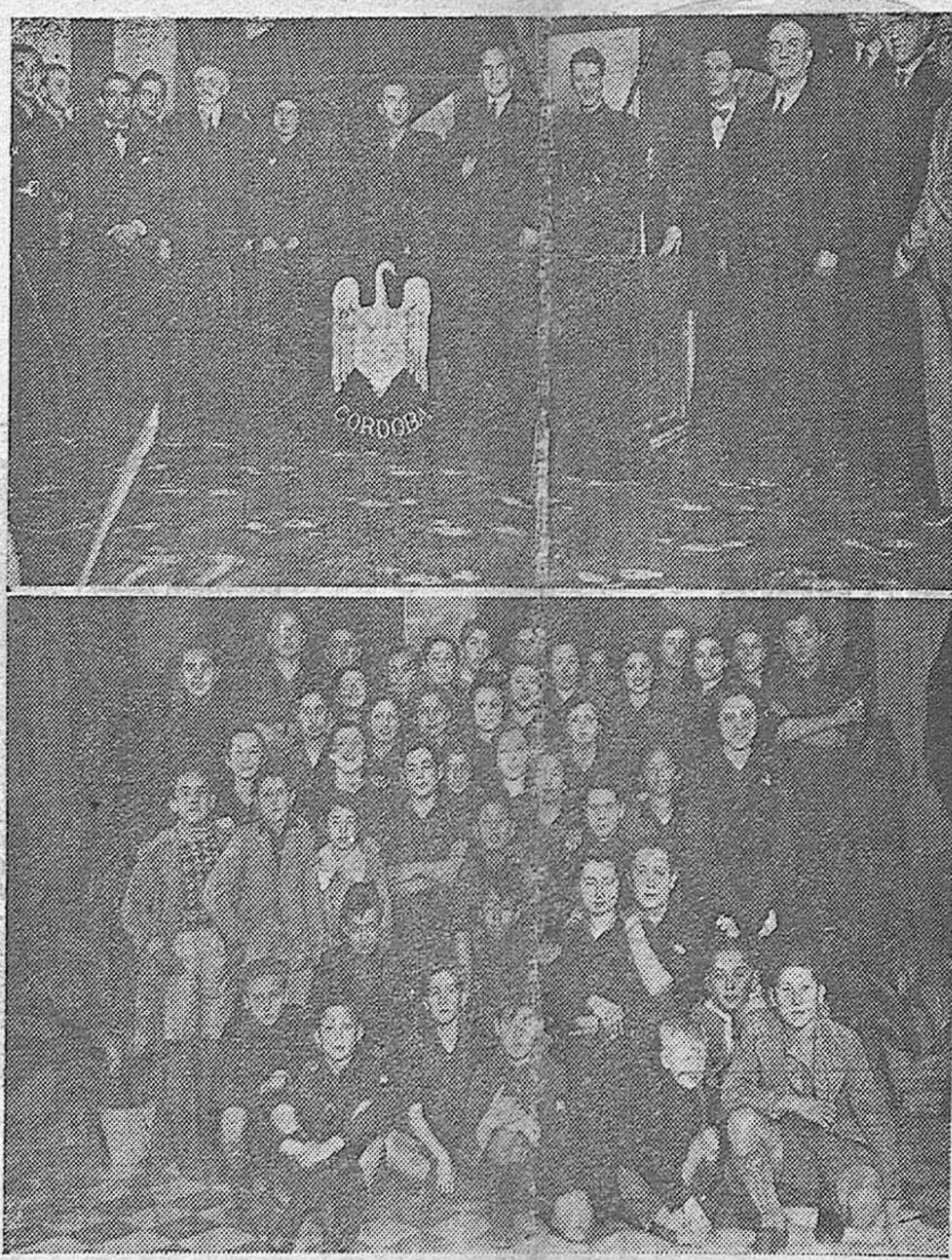
Mesa presidencial de los actos celebrados en el Instituto, con motivo de la Fiesta de Santo Tomás de Aquino.—Un grupo de escolares concurrentes a la Fiesta de la Cultura.