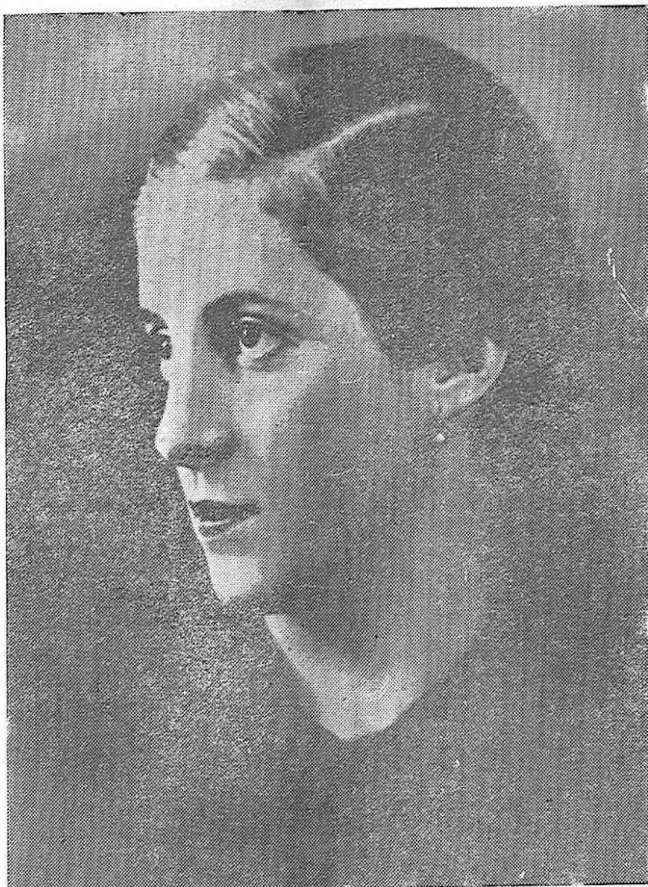
La Delegada Nacional de la Sección Femenina de Falange, Pilar Primo de Rivera