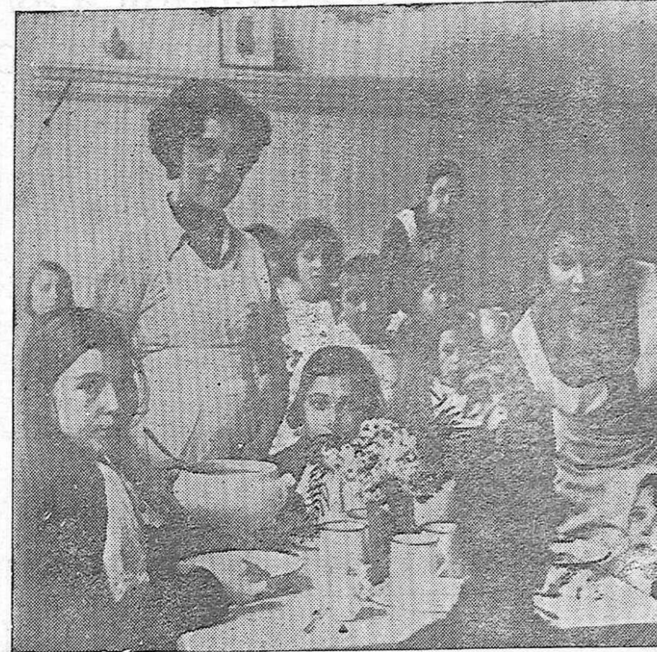
He aquí un comedor de "Auxilio Social" donde nuestras camaradas de la Sección Femenina cuidan a los pequeños, sirviéndoles el diario alimento que les proporciona la Falange