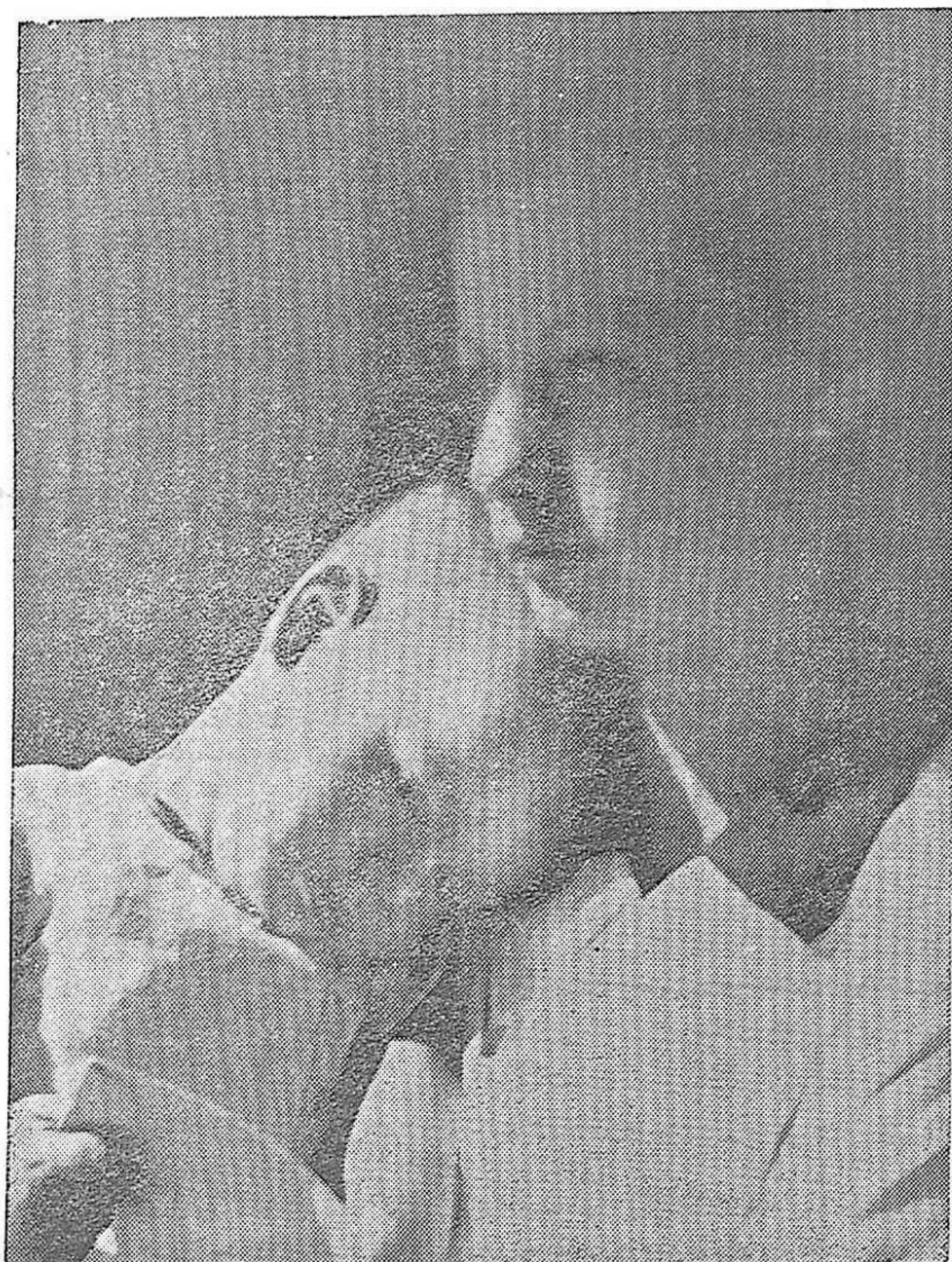
La mujer nacionalsindicalista pone su ternura maternal en los niños pobres. Misión cristiana y amorosa la suya. Hondo poema de piedad y consuelo, en el drama de los que nada tienen

el hambre, el frío y la miseria "AUXILIO SOCIAL" te pide que suscribas una "FICHA AZUL"