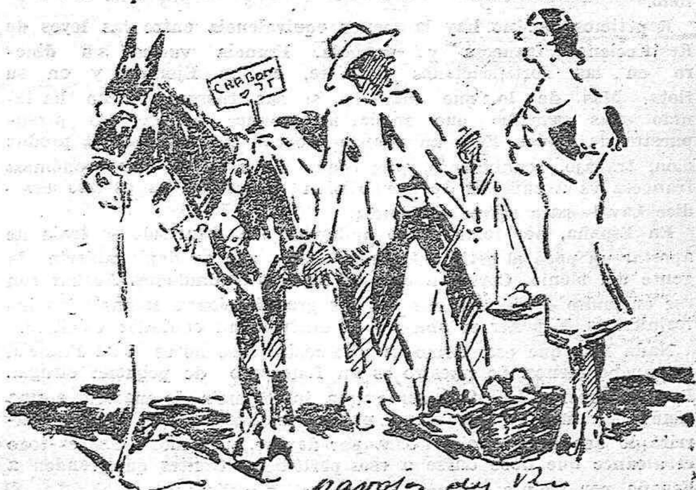
¡Niña, no me mire con esos ojazo tan negro, que me vá a tizná!