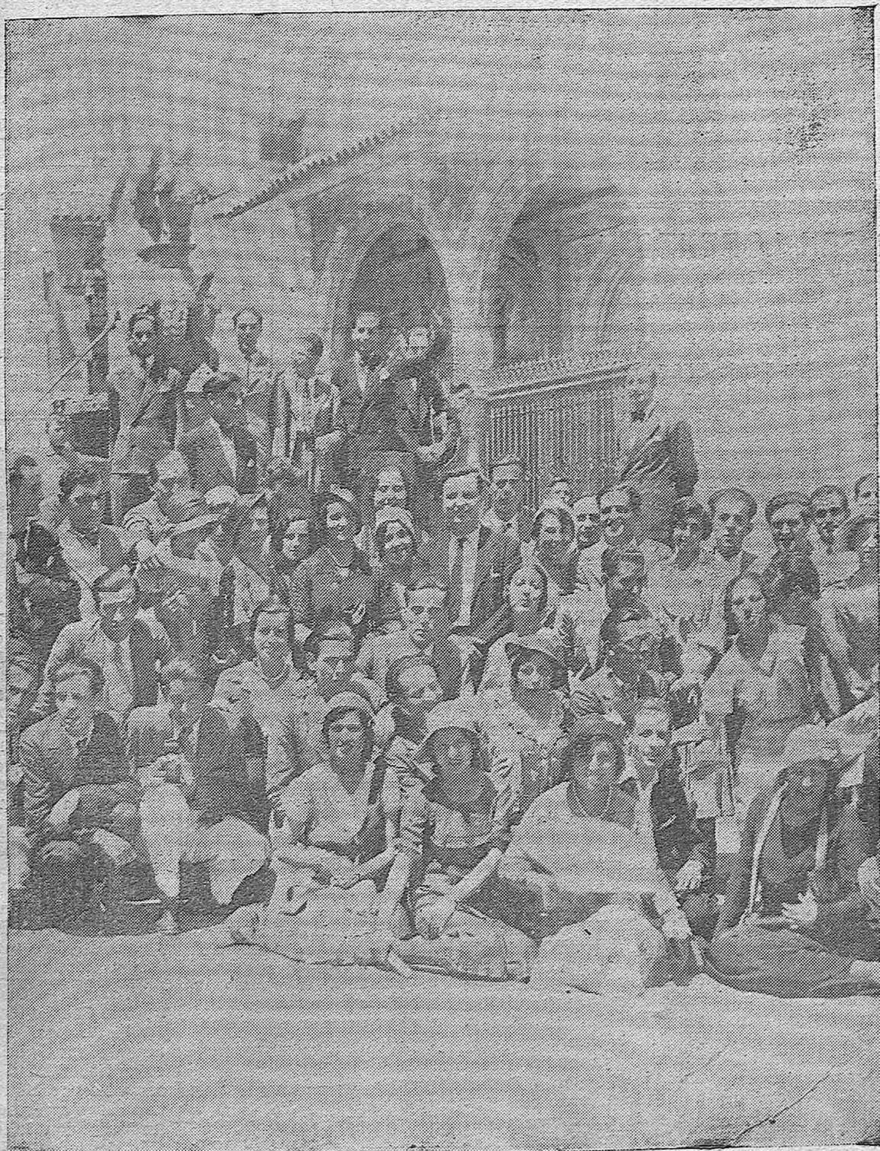
EN VIAJE DE ESTUDIOS.—Maestras y maestros cursillistas, que llegaron ayer a nuestra ciudad procedentes de Huelva