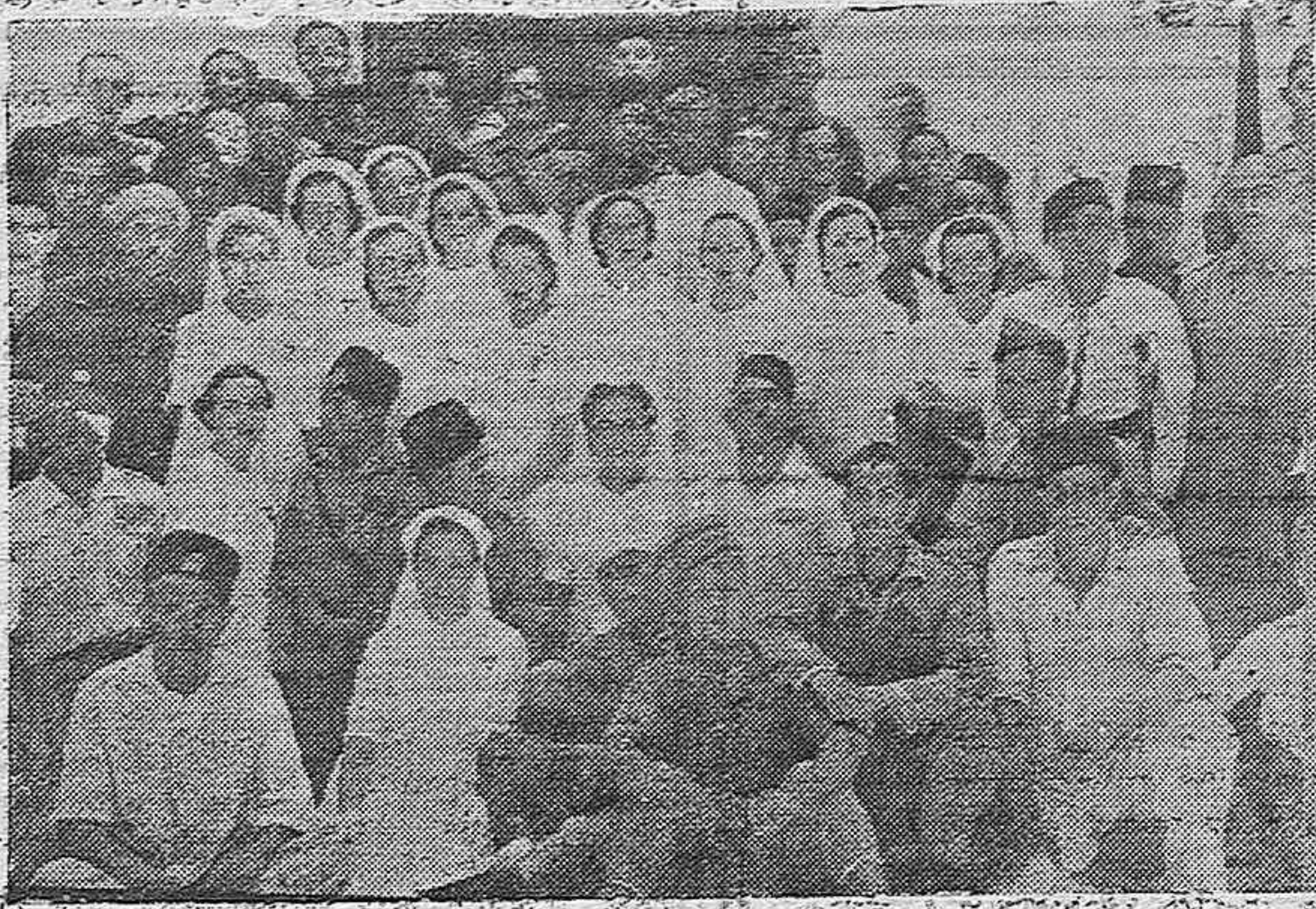
Enfermeras del Hospital Marroquí, a quienes les fué impuesta la condecoración que les ha otorgado S. A. I. El Jefe.