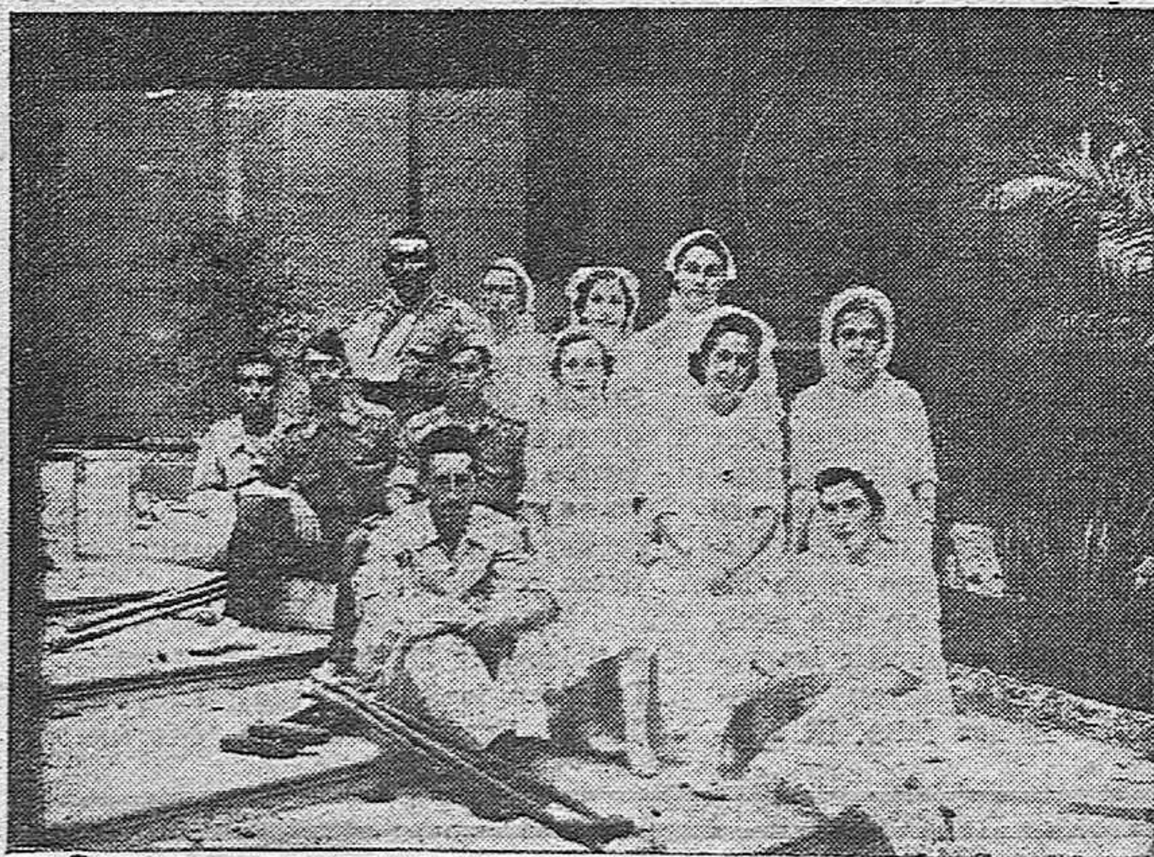
Nuestras camaradas enfermeras que asisten a los heridos en el Hospital Militar.

EN EL BAR MADRID: Jarabe de zarza, fresa y limón corriente a 2'75 litro. Zarza y limón especial, a 3'25 litro. Vermouth a 2'25 litro. Teléfono, 22-73.