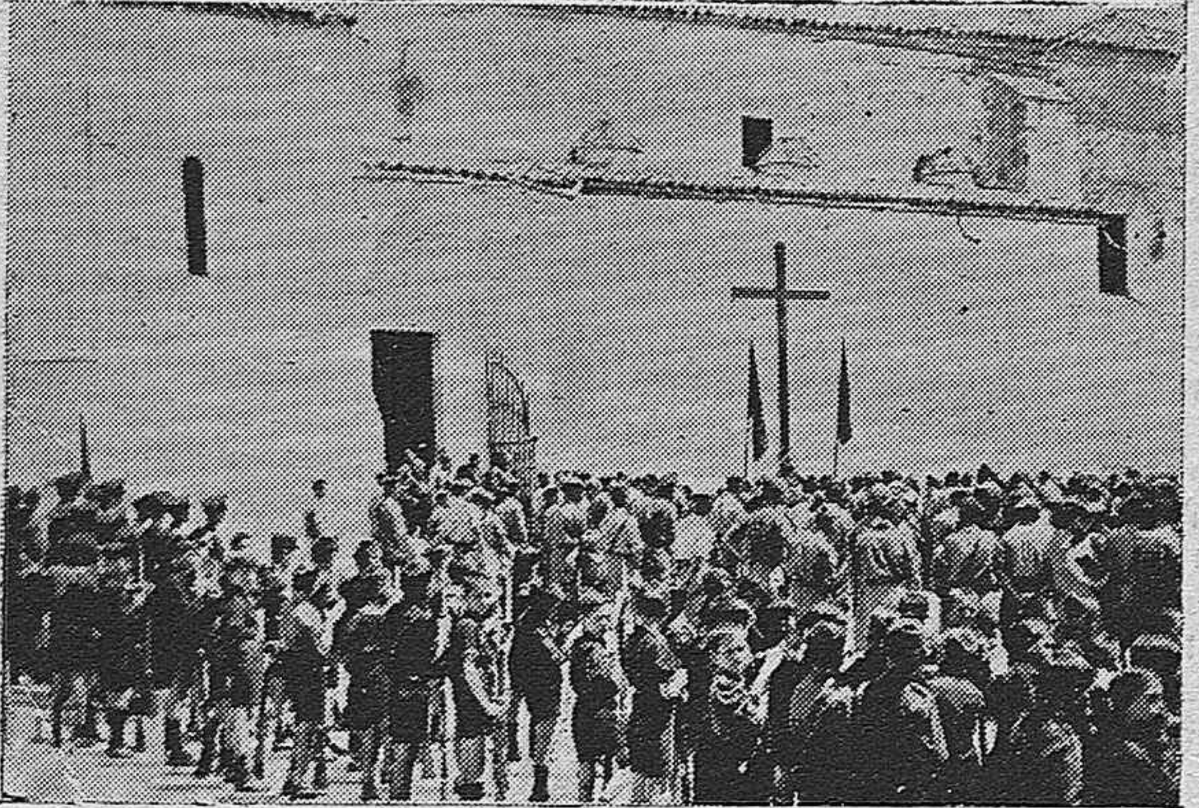
Los mandos de Falange de Córdoba, en su visita al Hospital de Villaharta.—Los flechas de Belmez, ante la Cruz de los Caídos.