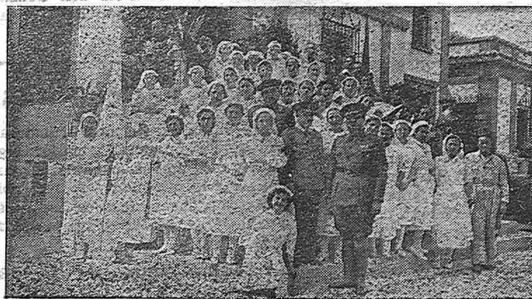
HOSPITAL DE LA CRUZ ROJA.—LOS MEDICOS RODEADOS DE LAS ENFERMERAS.

La Chatarra es de España. Quien la esconde, la usura; quien no la entrega, delinque.