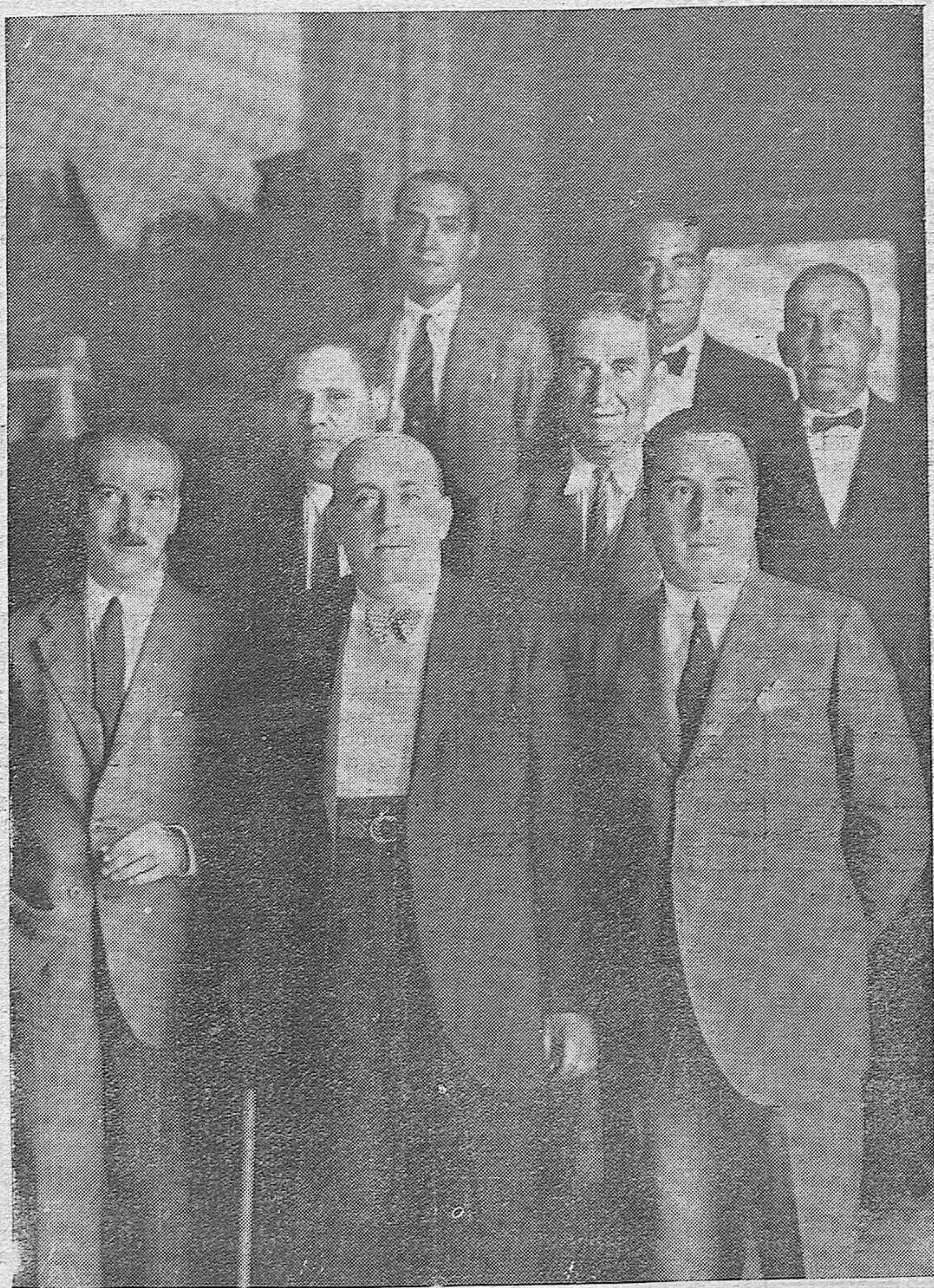
ANTE LA VISITA DEL PRESIDENTE.—El alcalde y concejales que marcharon a Priego para organizar todo lo relacionado con la próxima visita a Córdoba del presidente de la República española