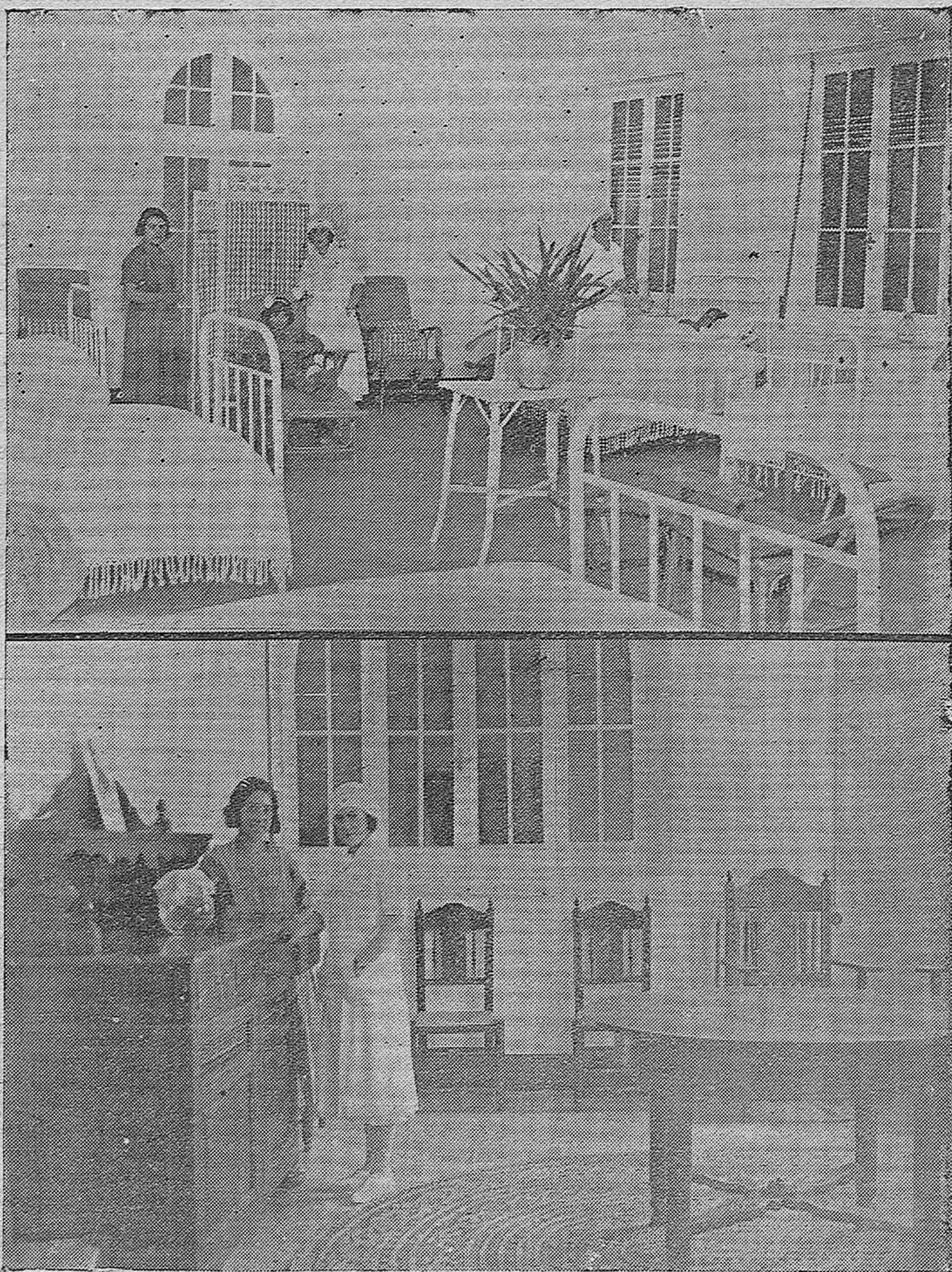
EL NUEVO HOSPITAL DE LA CRUZ ROJA.—Un aspecto de la sala general para hembras.—Un rincón del comedor para señoritas enfermeras