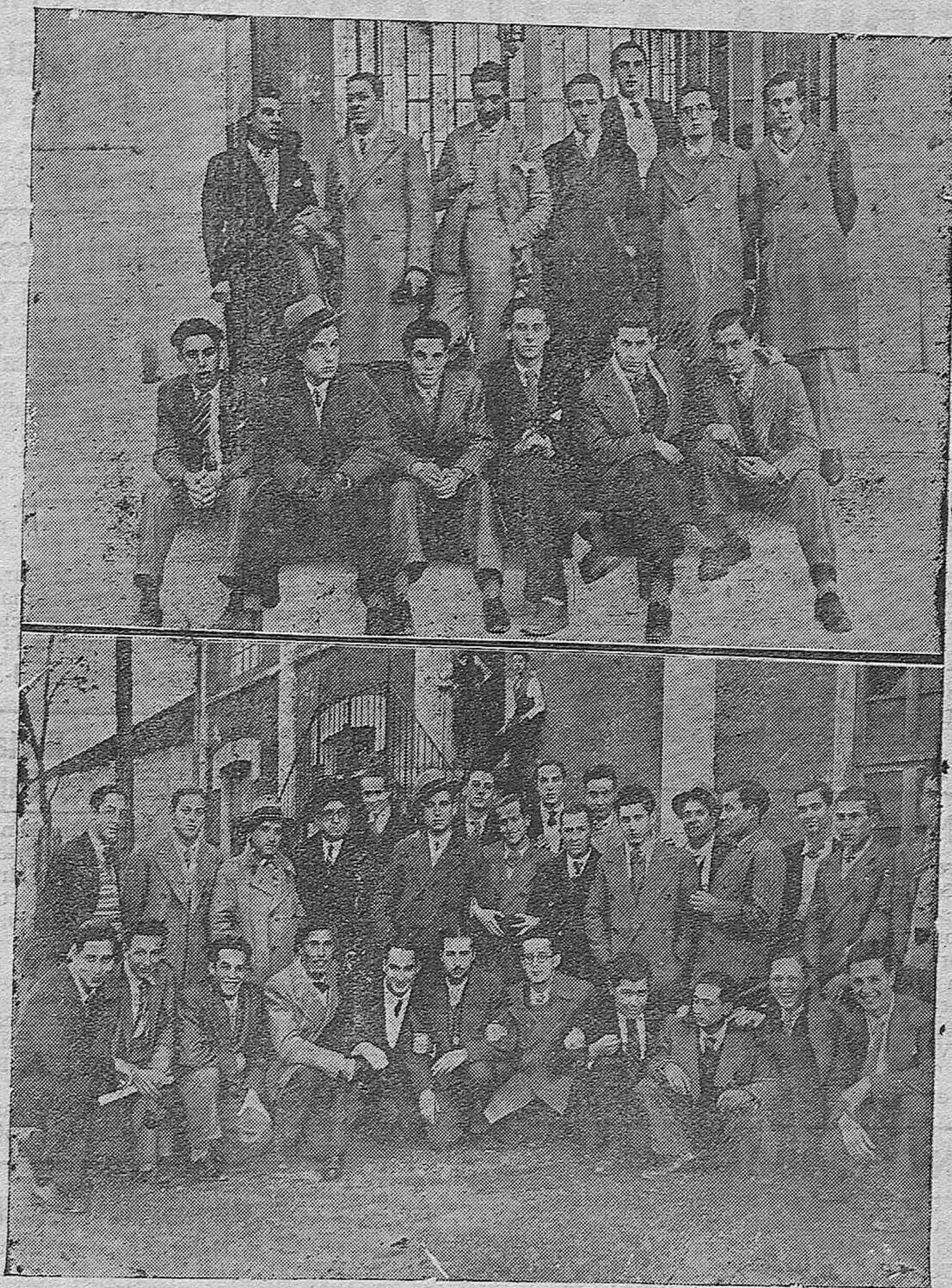
NOTAS GRAFICAS DE ACTUALIDAD. —Alumnos de la Escuela Superior del Trabajo, de Linares (Jaén) que han realizado una excursión de estudios a esta ciudad.—Grupo de técnicos-electricistas, durante su reciente visita a la Fábrica de Utensilios y productos Esmaltados