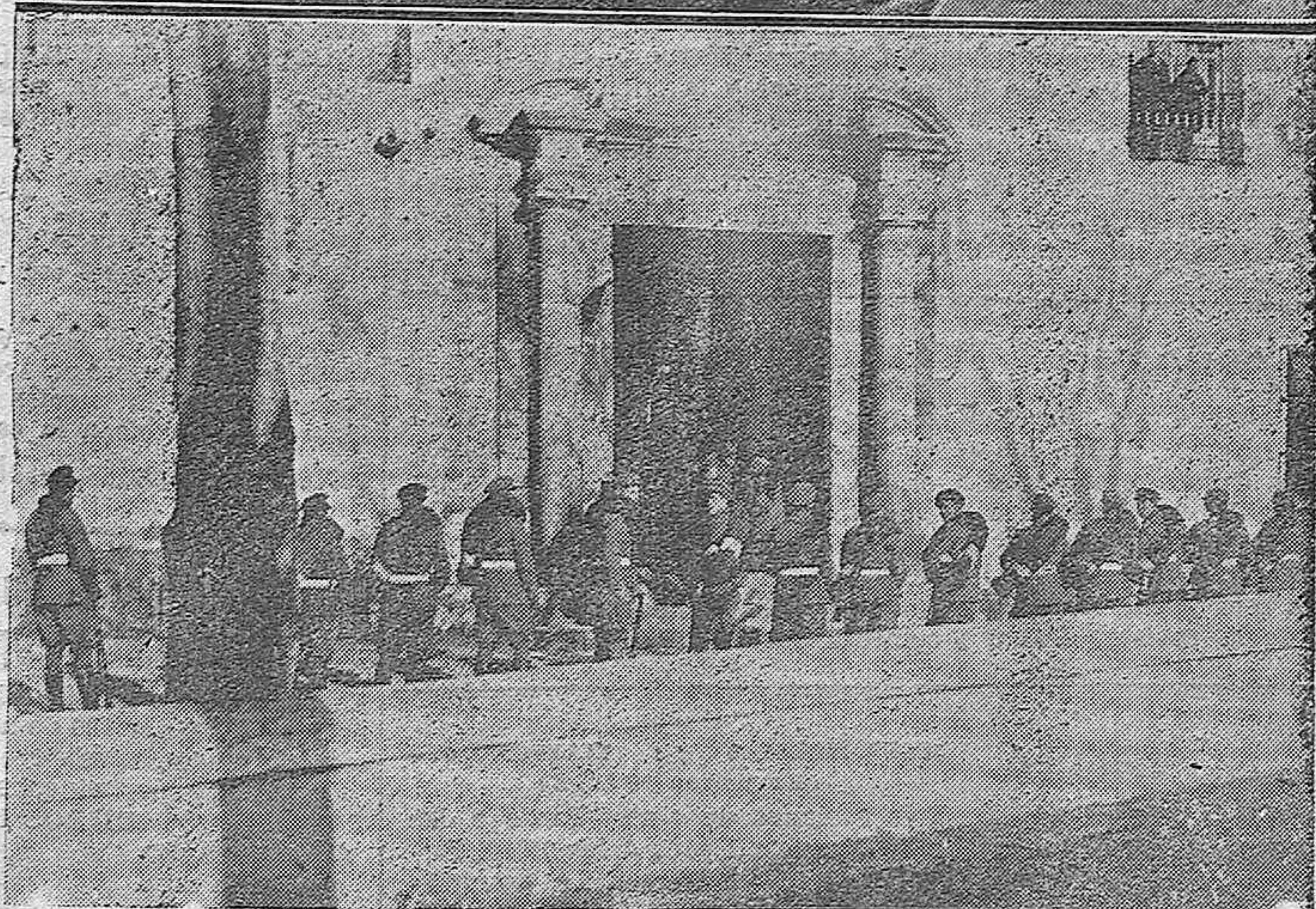
EL SUCESO DE ESTA MAÑANA EN LA CARCEL.—Aspectos de los alrededores de la Cárcel Provincial, en la que se adoptaron medidas de precaución y previsión con motivo del alboroto que produjeron los presos por asuntos sociales