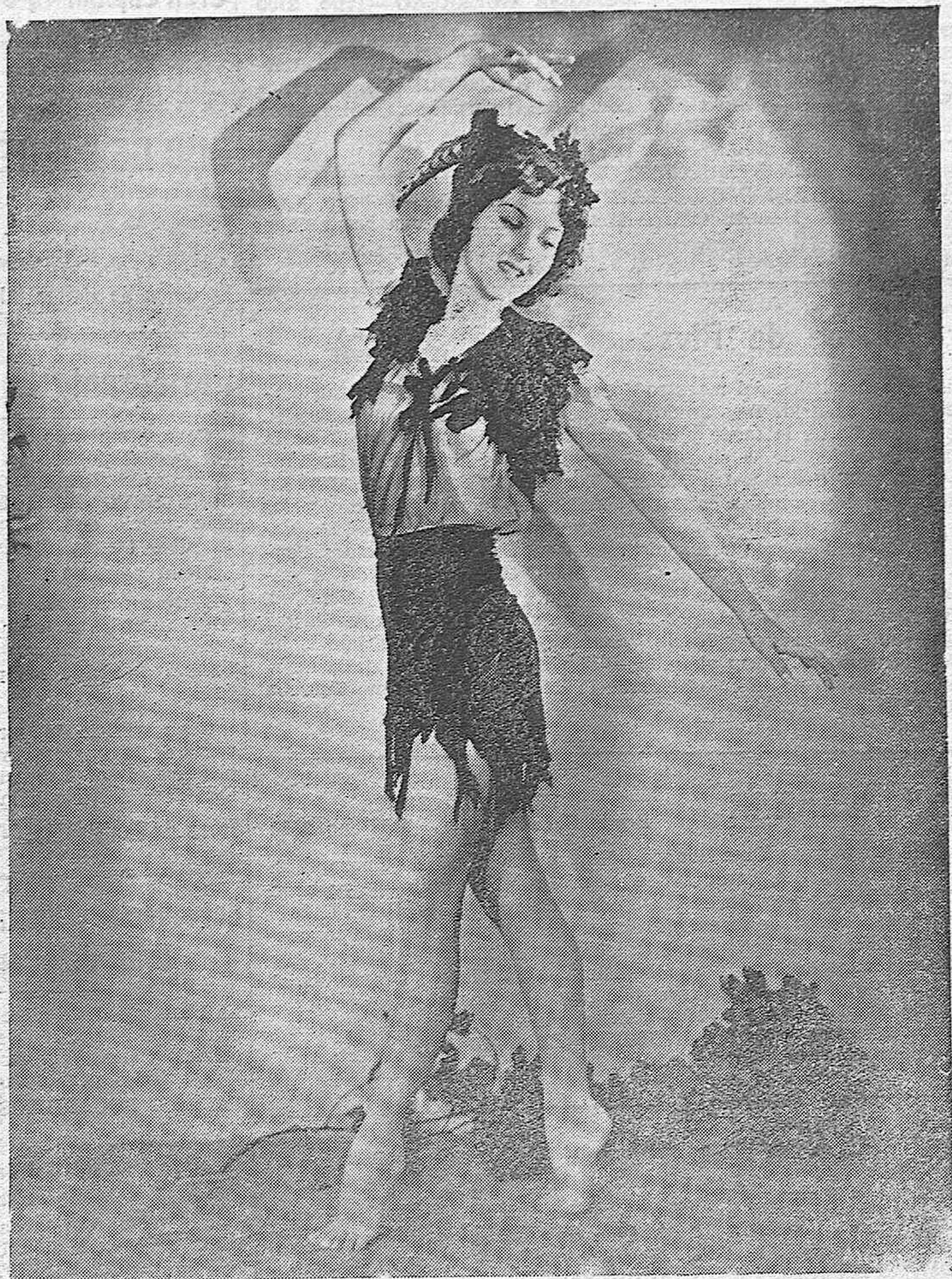
ARTISTAS DE LA PANTALLA.—La bella artista Jane Paeker, una de las más destacadas "star" en el firmamento de Hollywood