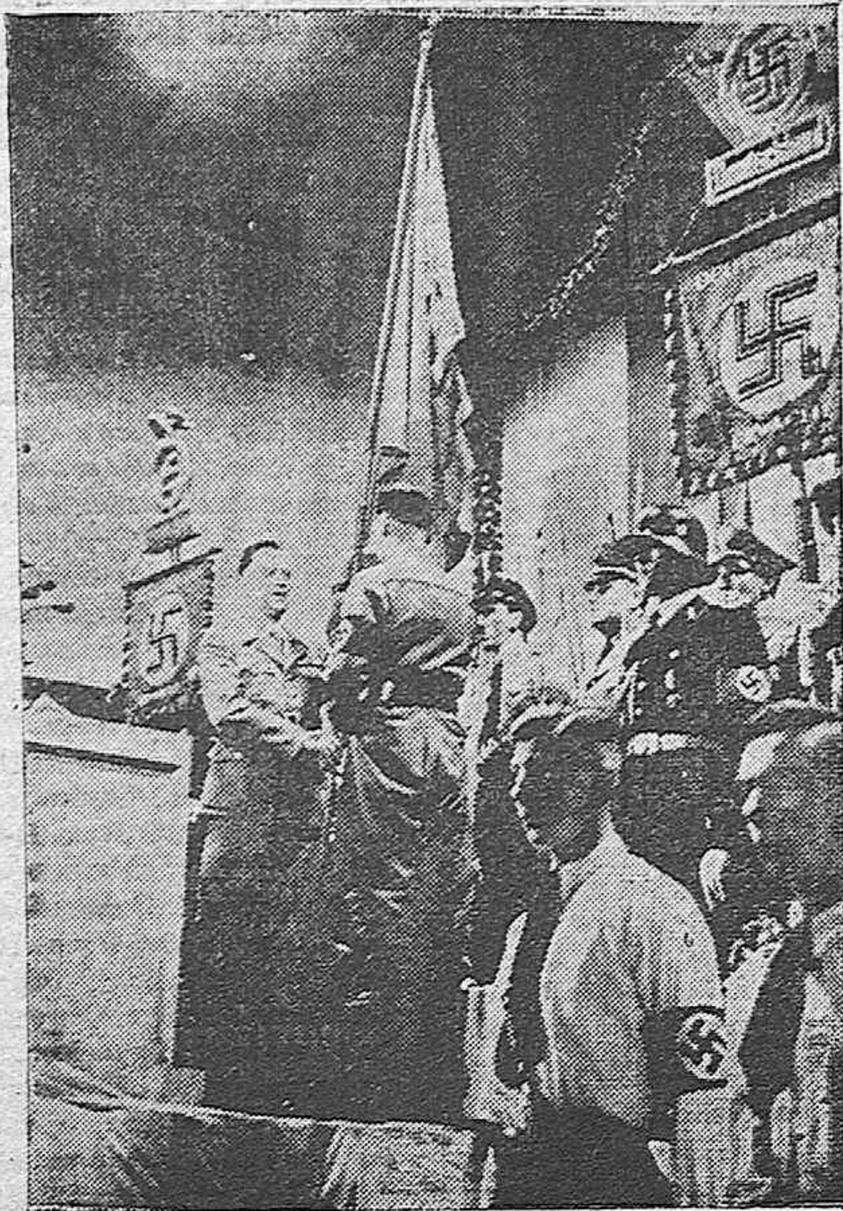
El Partido de los Sudetes Alemanes entra a formar parte del nacionalsocialista. Rodolfo Hess presidía la ceremonia de la fusión. La foto muestra el acto simbólico tocando la bandera de la S. D. P. con la bandera de la sangre. Enfrente de Rodolfo Hess se encuentra Konrad Henlein.