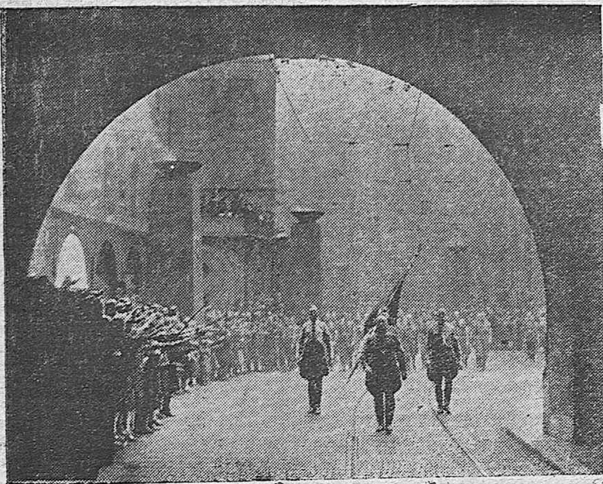
En conmemoración de los primeros caídos por el nacional-socialismo delante de la «Feldherhalle» en Munich se celebra solemnemente una ceremonia en su recuerdo el día 9 de Noviembre de cada año. La foto muestra la marcha de los antiguos militantes por las calles de la capital del Movimiento.