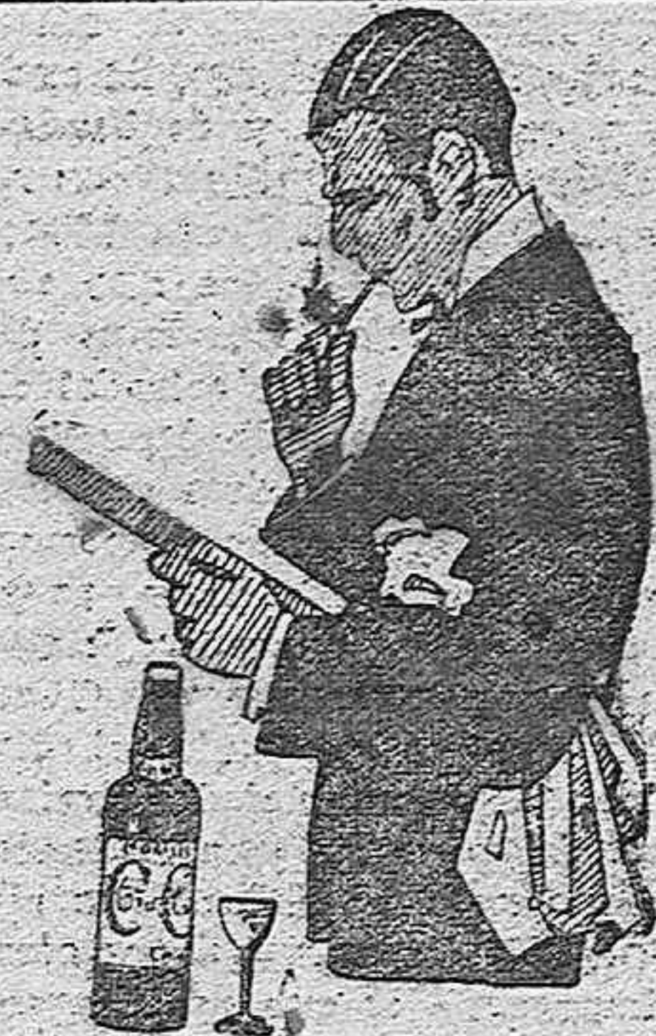
MONTILLA, siempre Cruz Conde