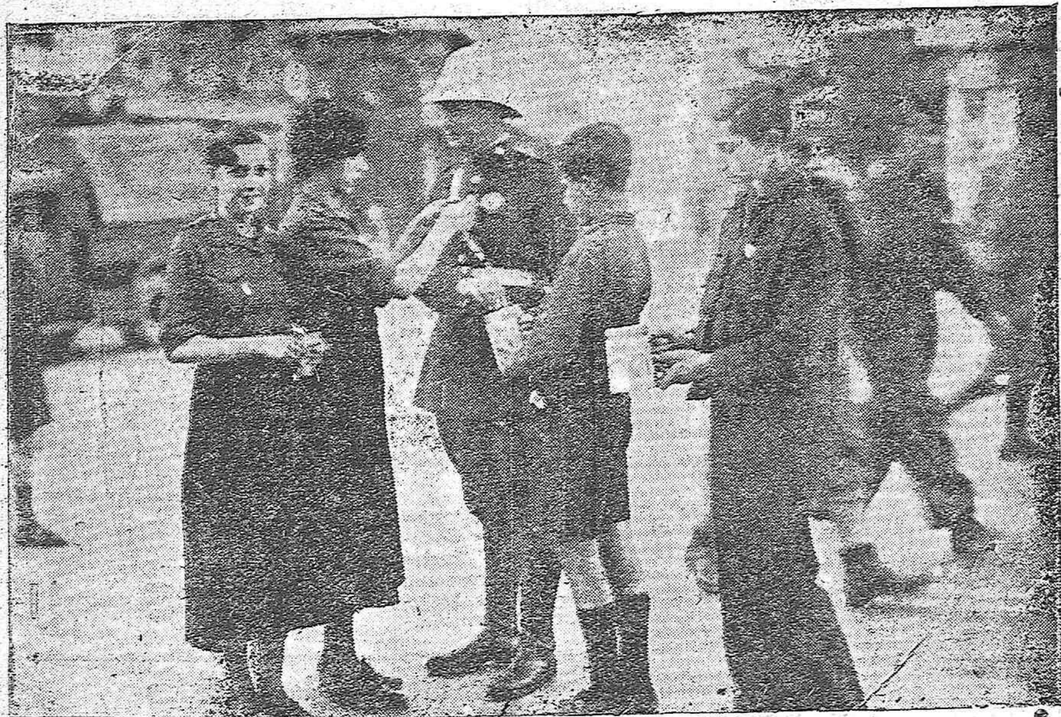
La colecta para Auxilio de Invierno en Córdoba.—Nuestras camaradas de la Sección Femenina, en plena labor patriótica.

La fé del espíritu que a todos nos anima. fué la que hizo a Falange ser precursora de este gran Movimiento Nacional. GENERALISIMO FRANCO.