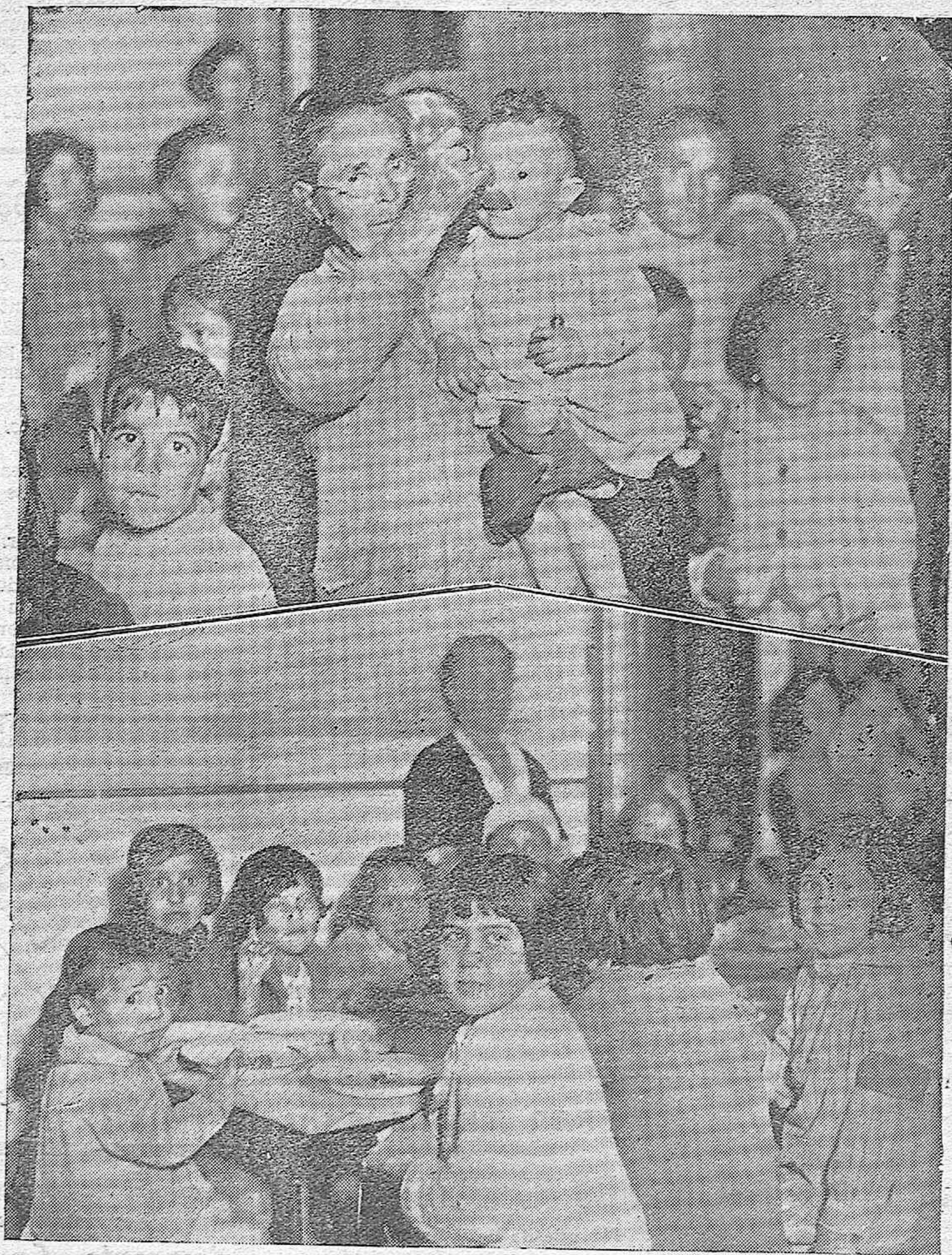
EL COMEDOR DE CARIDAD Y LA CRISIS OBRERA. —Dos momentos interesantes del espectáculo diario que ofrecen los cientos de niños, hijos de obreros en su mayoría, que allí reciben en concepto de socorro, raciones de comida. El pueblo cordobés debe darse cuenta de la enorme labor social de la Cocina Económica y Comedor de Caridad y prestarle su decidida ayuda en favor de los desvalidos de los que nos ocuparemos en un próximo reportaje