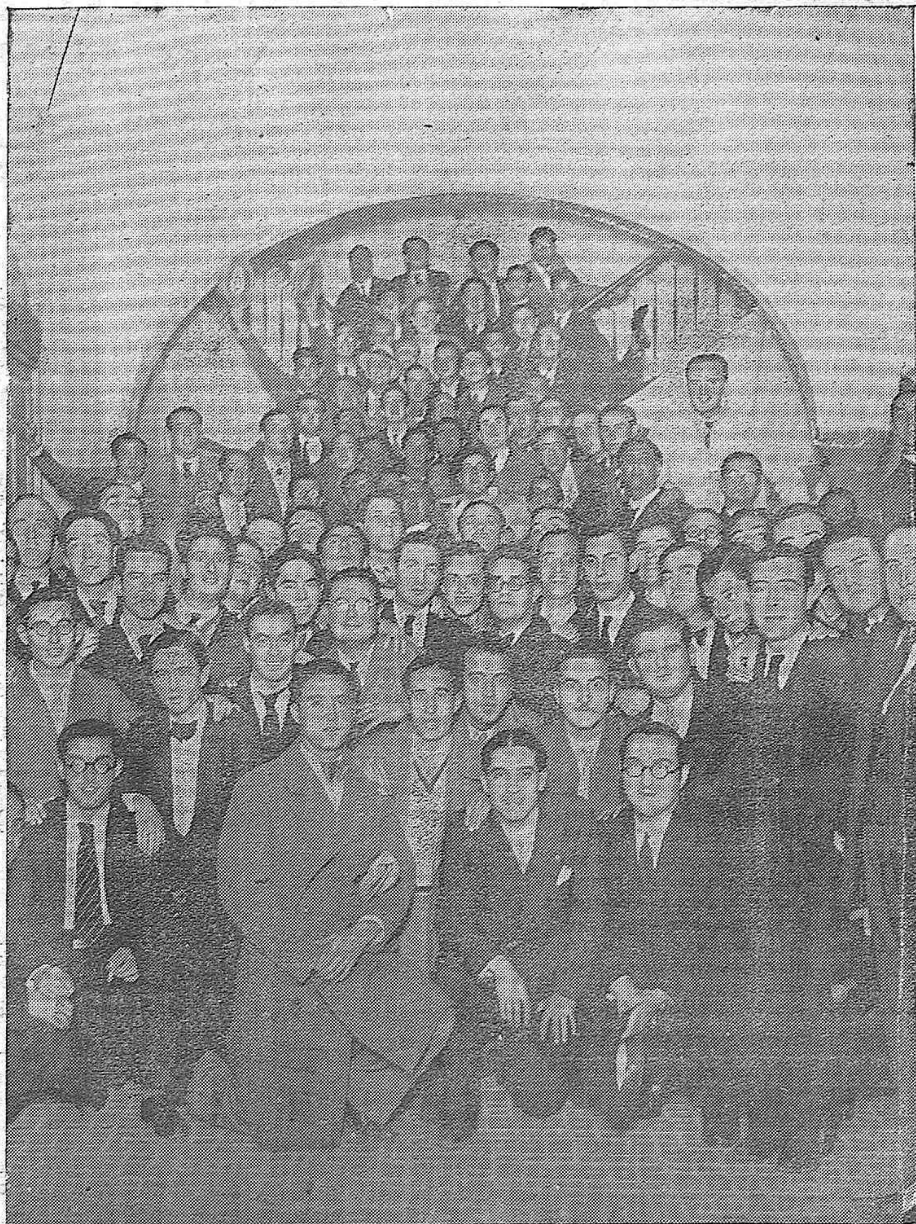
EL CONFLICTO ESCOLAR.—Grupo de alumnos de la Escuela de Veterinaria que celebraron una reunión, en la que tomaron acuerdos relacionados con la huelga