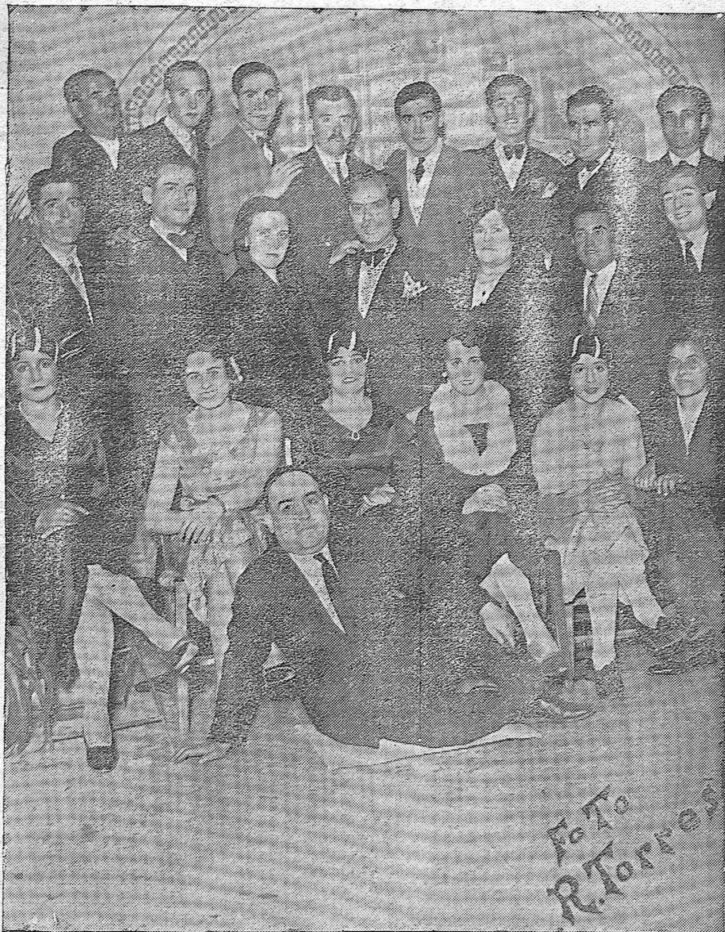
Jóvenes pertenecientes a la Agrupación Artística Benavente, que han actuado con gran éxito en varios pueblos de esta provincia