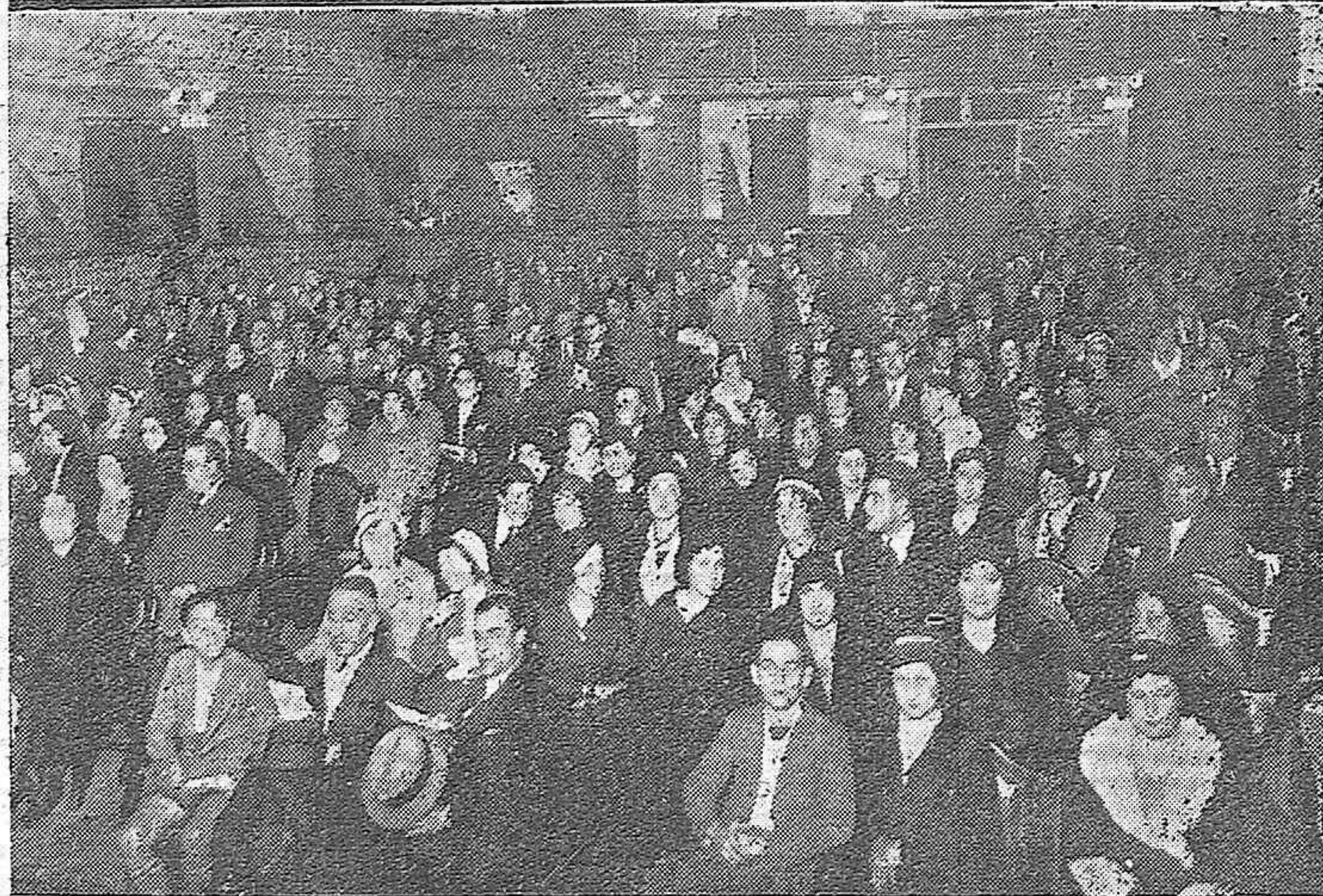
LA SEMANA PEDAGOGICA EN CORDOBA.—Presidencia del acto de apertura celebrado ayer en el Gran Teatro, con asistencia del señor Gobernador civil de la provincia.—Un aspecto del patio de butacas durante la sesión inaugural