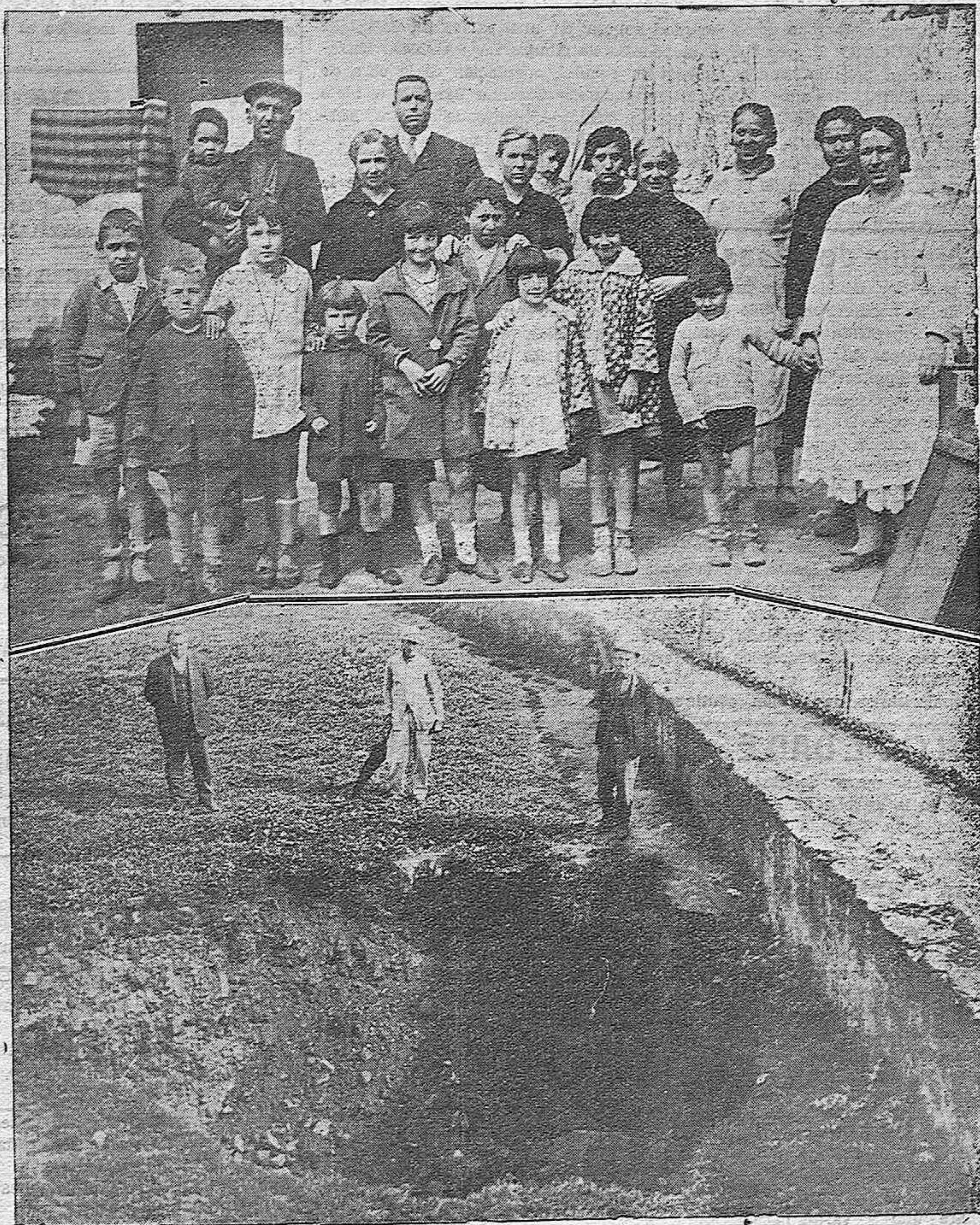
EFFECTOS DEL TEMPORAL. —Familias que habitan la casa de la Plaza del Alcázar, que a consecuencia del reventón de la alcantarilla, tuvieron en peligro sus vidas y han perdido la mayor parte de sus ropas.—Enorme agujero abierto en el pavimento, por el cual buscaron la salida las aguas, al encontrar la obstrucción de la alcantarilla.